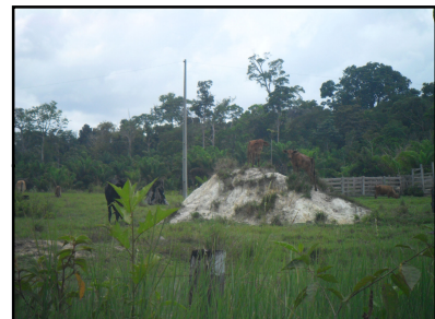
Ponto Notável N° 54 - Vicinal com fazenda de gado