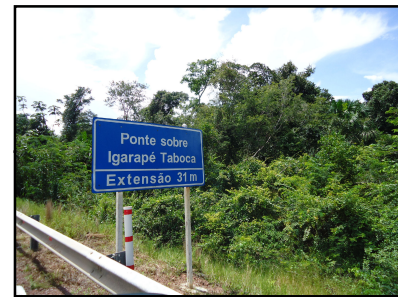
Ponto Notável N° 42 - Igarapé Taboca