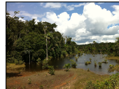
Ponto Notável N° 21 - Igarapé Sem Nome afluente do Rio Cuieiras