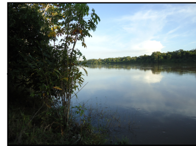
Ponto Notável N° 71 - Rio Mucajai