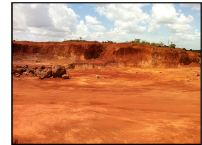
Ponto Notável N° 72 - Cascalheira desativada

© Ecology & Environment do Brasil GIS Department W:\2517-LT500KV_Manauas-BoaVista\EIA_rev01\MXD\2517-01-EIA-MP-5001-01_PontosNotaveis_FL75.mxd 14/03/2014