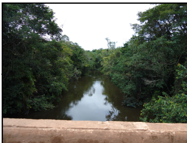
Ponto Notável N° 49 - Igarapé Matim