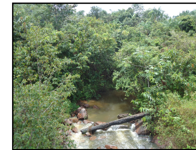
Ponto Notável N° 36 - Igarapé Canastra

© Ecology & Environment do Brasil GIS Department W:\2517-LT500KV_Manauas-BoaVista\IAIA_rev01\MXD\2517-01-EIA-IP-5001-01_PontosNotaveis_FL15.mxd 13/03/2014