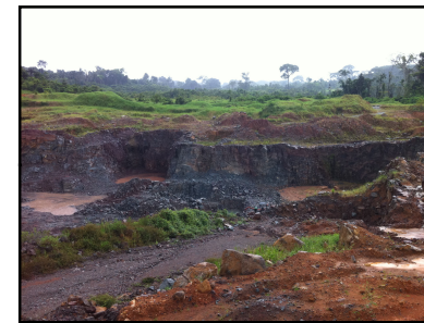
Ponto Notável N° 35 - Pedreira EBAM Manaus