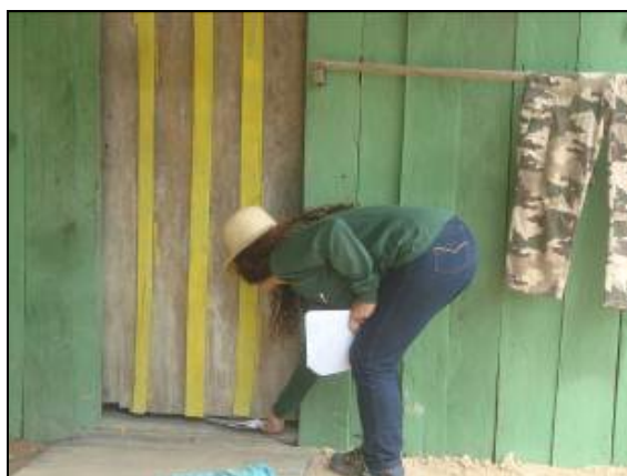
Foto 139 - Informe deixado na propriedade de Maria Dos Remédios Aleixo Nascimento.