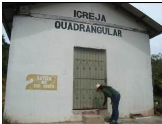
Foto 60 - Informe deixado na Igreja Quadrangular.