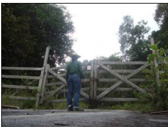
Foto 83 - Informe deixado na propriedade de Antônio Aluísio B. Filho.