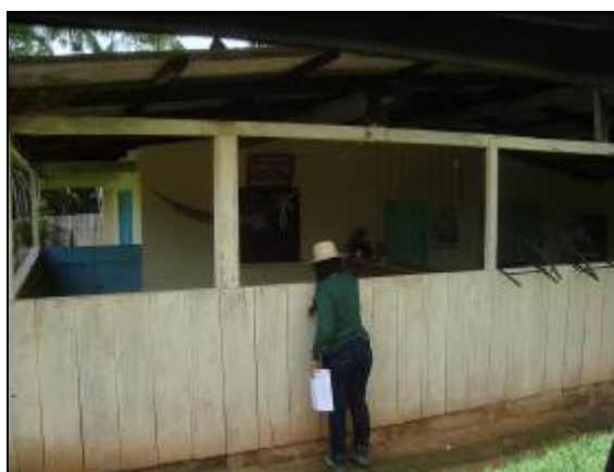
Foto 143 - Informe entregue na propriedade de Carla Loureira de Souza.