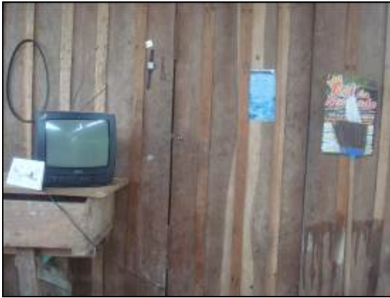
Foto 120 - Informe deixado na propriedade do Sr. Sebastião Pereira Vieira.