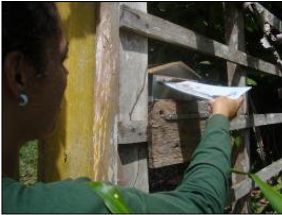
Foto 37 - Informe entregue na propriedade de A Martins Construções LTDA.