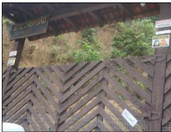
Foto 22 - Informe entregue na porteira da propriedade de Marilda Bowen.