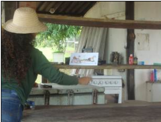
Foto 110 - Informe deixado na propriedade de Sr. Luiz Carlos Perrone Negreiros.