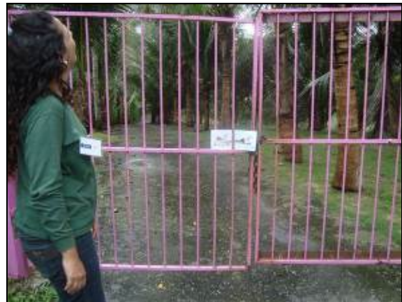
Foto 28 - Informe entregue na porteira da propriedade de Agnaldo Brito.