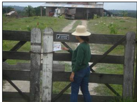
Foto 78 - Informe deixado na propriedade de Raimundo Maciel de Souza.