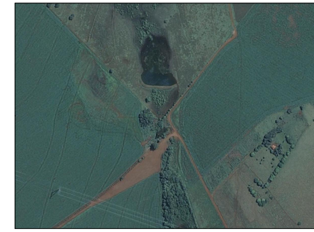
132- Área Alagada

Referência - Imagem Ikonos, 2009; - Pesquisa de campo relativas ao meio físico, biótico e socioeconômico, realizadas em janeiro 2010.