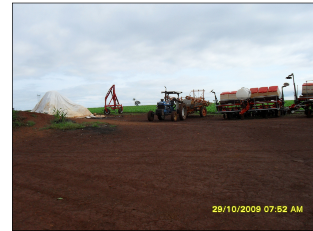
133- Propriedade de Denilson. Principal atividade é o cultivo de soja e milho