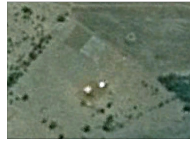
127- Sítio da propriedade de D. Amália