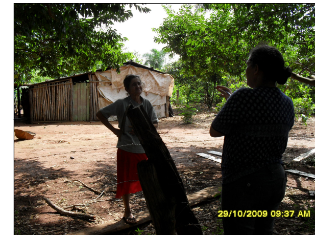
130- Sítio Jandiara