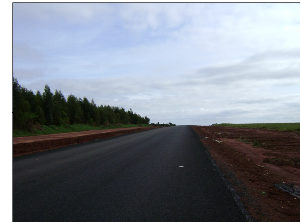
129- GO 174