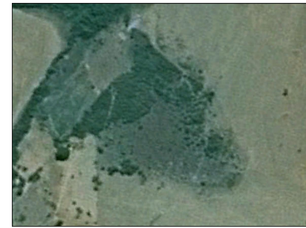
131- Área Alagada