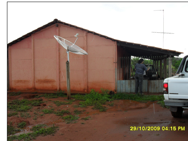
126- Propriedade da Cleuza. Principal atividade é a pecuária