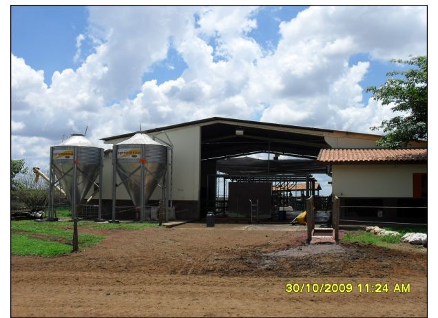
117- Fazenda 2J.1

Elab.: Bruno Dester Visto: Aprovado: Escala: 1:25.000 FL.: 32 de 36 Data: Fevereiro/2010 Mapa n°: 2383-00-EIA-DE-5001 Revisão: 00