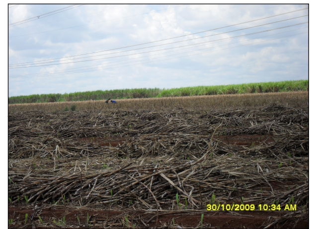
118- Fazenda JS - Área usada para plantio de cana de açúcar