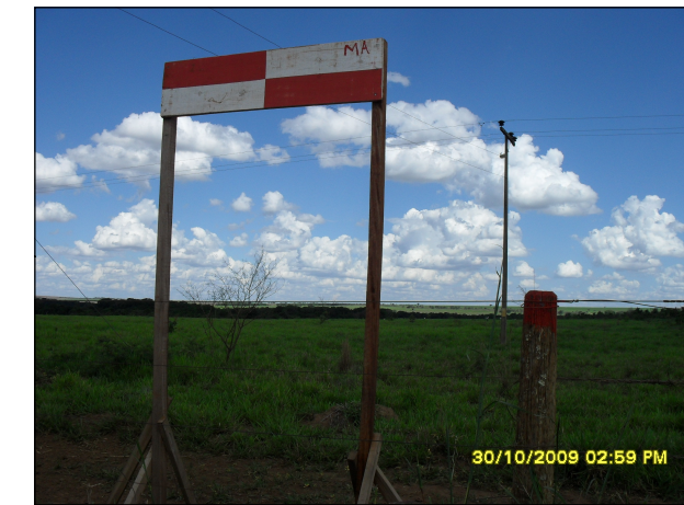
113- Marcação do traçado da futura LT - Estrada GO-220 entre Montividiu e Caiapônia