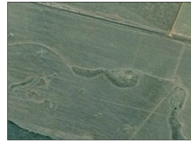
115- Área Alagada