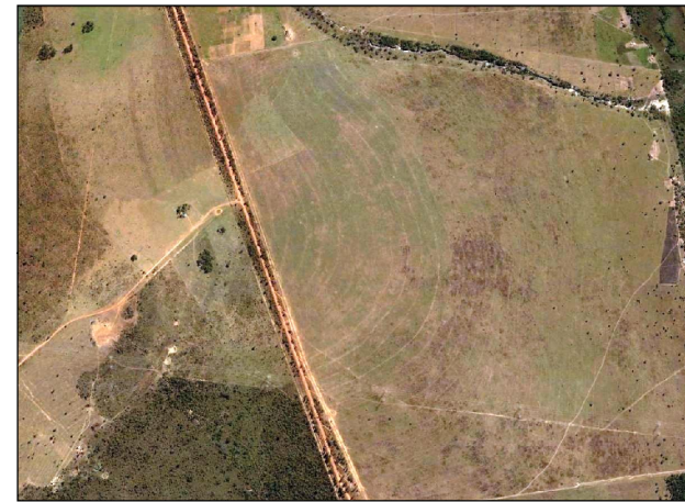
63- Marcação do traçado da futura LT - Entrada para o assentamento Oziel Alves Pereira