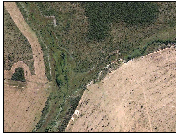
64- Área Alagada