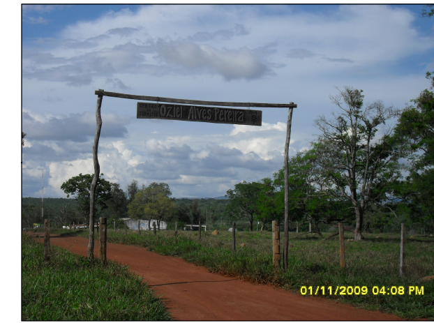
65- Assentamento Oziel Alves Pereira