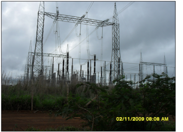
60- Subestação Ribeirãozinho