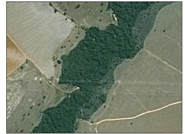
59- Rio São Domingos

Referência - Imagem Ikonos, 2009; - Pesquisa de campo relativas ao meio físico, biótico e socioeconômico, realizadas em janeiro 2010.