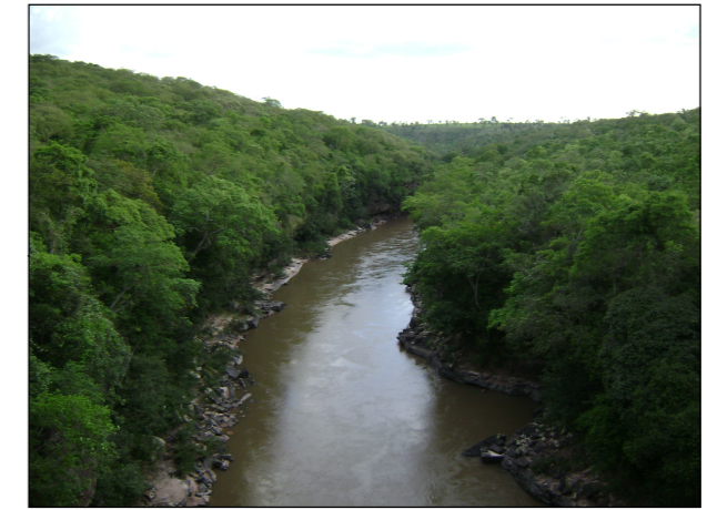
62- Rio Araguaia