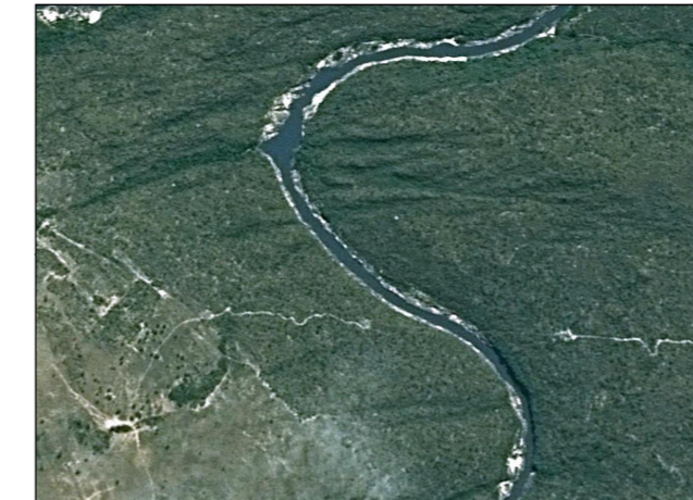
61-Margem do Rio Araguaia - Área de Cerrado Rupestre