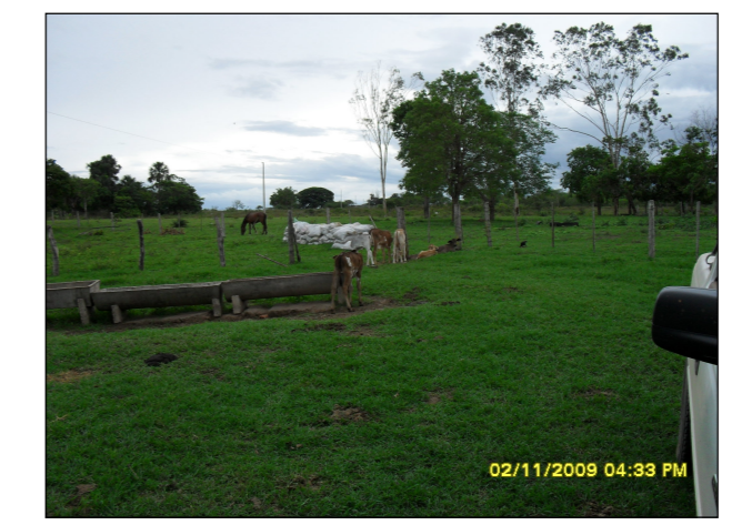
49- Área Ocupada por extensa plantação de Soja