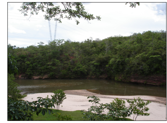
48- Rio das Garças