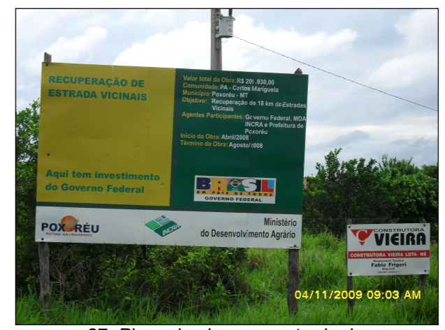
27- Placa de obras na entrada do Assentamento Carlo Mariguella