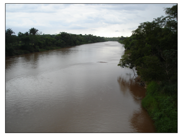
24- Rio Vermelho

Elab.: Bruno Dester Visto: Aprovado: Escala: 1:25.000 FL.: 11 de 36 Data: Fevereiro/2010 Mapa n°: 2383-00-EIA-DE-5001 Revisão: 00