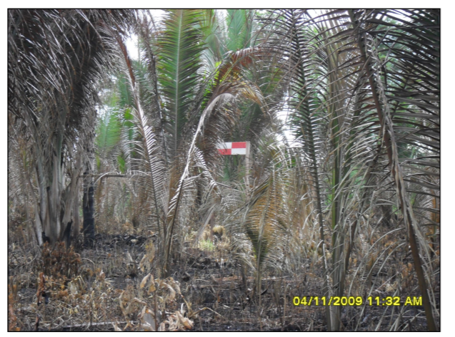
25- Indicação do traçado da futura LT