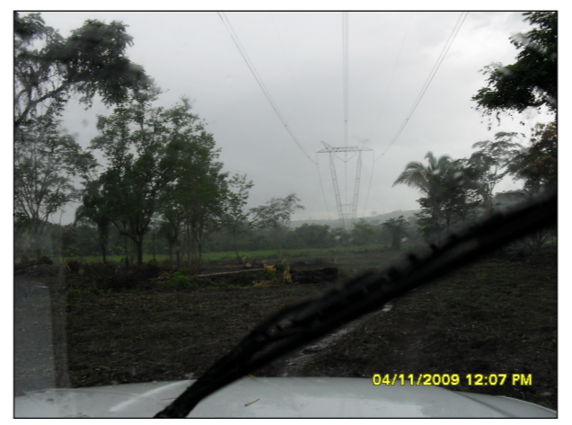
26- Linha de transmissão Itumbiara - Cuiabá