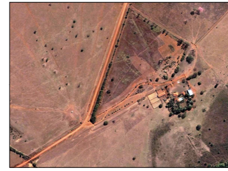
19- Córrego Amaral