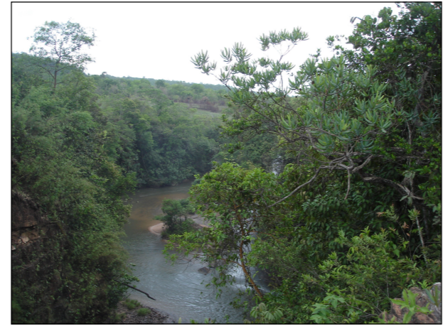
16- Córrego Amaral