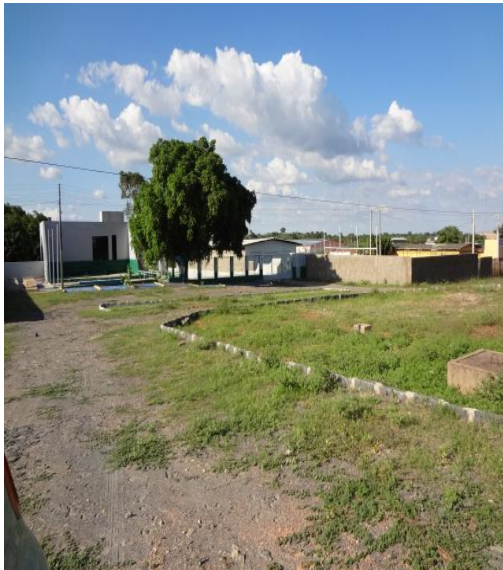
Figura 3 – Área para Canteiro de Obra "Cajazeiras 03".