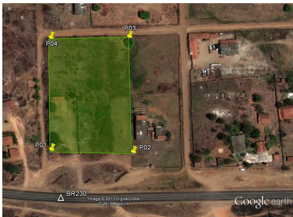
Figura 1 - Localização do canteiro de Obra "Cajazeiras 03".

A área do canteiro de obra “Cajazeiras 03” está localizada no município de Cajazeiras, no estado da Paraíba, zona urbana – Distrito Industrial, próximo à rodovia federal BR-230, sob as Coordenadas DATUM SIRGAS2000 551600.00E / 9237729.00N (Figura 1), fuso 24, localizada a 03 km do centro da cidade de Cajazeiras.