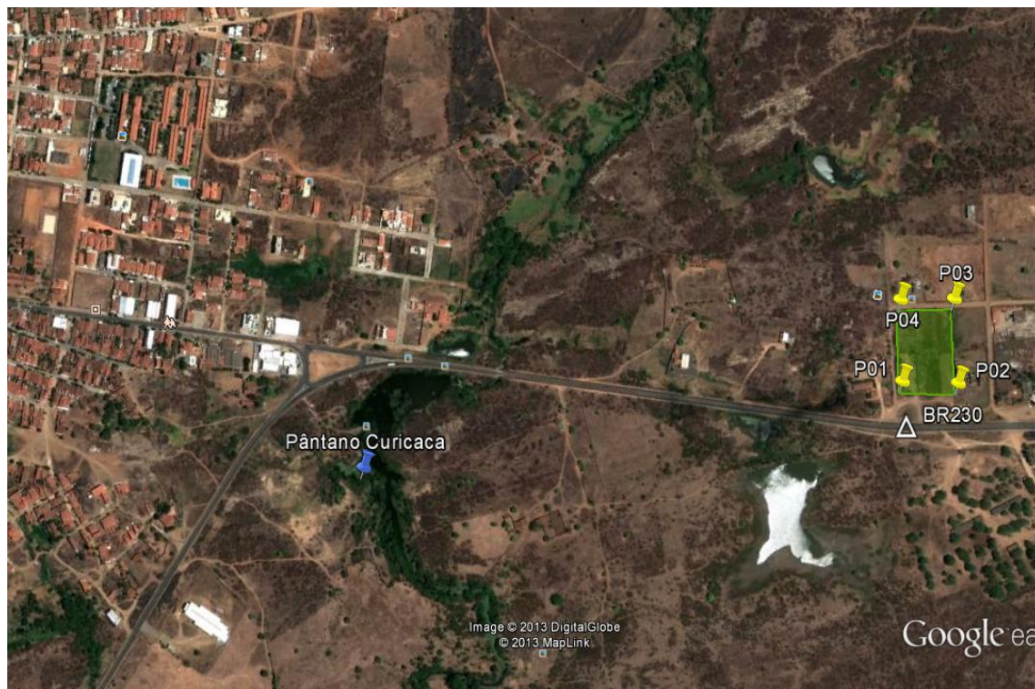
Figura 2 - Acesso ao canteiro de Obra "Cajazeiras 03".

O principal acesso ao canteiro de obras "Cajazeiras 03" é a rodovia federal BR-230 (Figura 2).