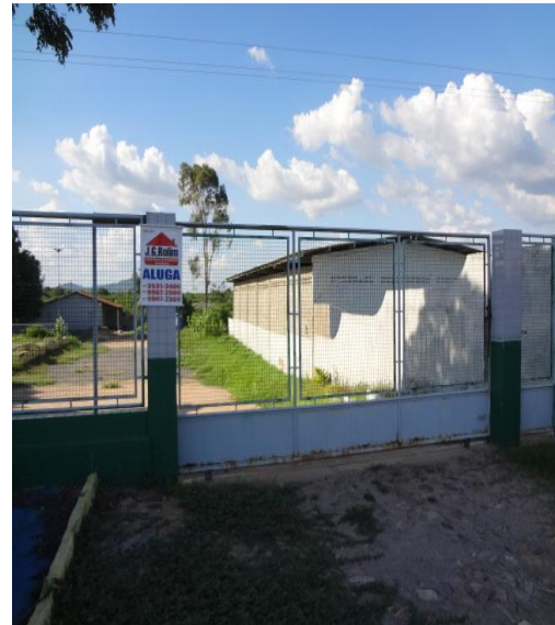
Figura 4 – Entrada da área "Cajazeiras 03".

Em seu entorno, encontram-se propriedades rurais, cuja atividade predominante é a agropecuária e Industrial. Verificou-se a presença do Pântano da Curicaca no lado esquerdo da área, porém há poucas evidências de áreas florestais significativas.