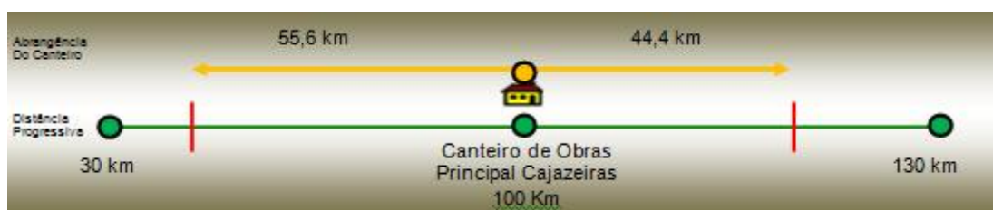
Ilustração 1 - Plano de Ataque e Abrangência para o Canteiro de Cajazeiras – PB

Esta área, se escolhida como canteiro de obra, armazenará todo material necessário para a construção do empreendimento no trecho compreendido nos limites apresentados na Ilustração 1.