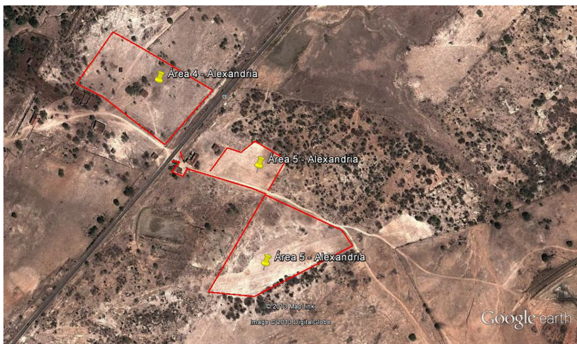
Figura 1 - Localização do canteiro de Obra "Alexandria 05" (Fonte: Google Earth, 2013).

A área do canteiro de obra “Alexandria 05” está localizada no município de Alexandria, no estado do Rio Grande do Norte, zona rural, próximo à rodovia estadual RN-117, sob as Coordenadas DATUM SIRGAS2000 610720.00E / 9294634.00N (Figura 1), fuso 24, localizada a 3,5 km da zona urbana do município de Alexandria.