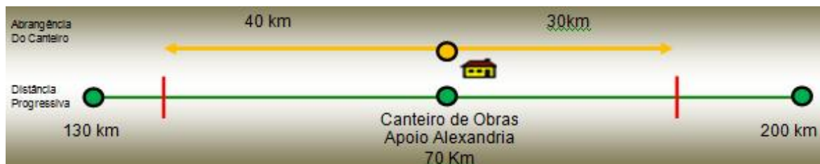
Ilustração 1 - Plano de Ataque e Abrangência para o Canteiro de Alexandria – RN

Esta área, se escolhida como canteiro de obra, armazenará todo material necessário para a construção do empreendimento no trecho compreendido nos limites apresentados na Ilustração 1.