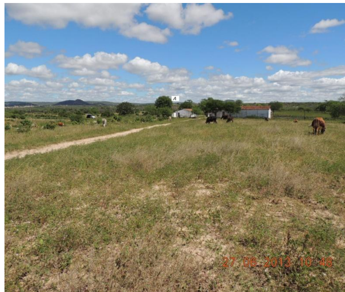
Figura 5 – Área para Canteiro de Obra "Alexandria 05" (Fonte: ATE XVII, 2013).

Em seu entorno, encontram-se propriedades rurais, cuja atividade predominante é a agropecuária. Não há indícios de áreas florestais significativas.