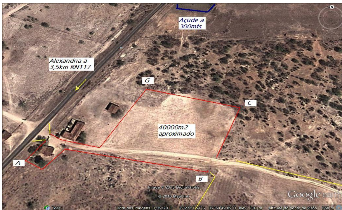
Figura 2 - Acesso ao canteiro de Obra "Alexandria 05".

O principal acesso ao canteiro de obras "Alexandria 05" é a rodovia estadual RN-117 (Figura 2).