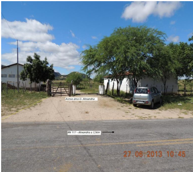
Figura 3 – Entrada para área do Canteiro de Obra "Alexandria 05" (Fonte: ATE XVII, 2013).