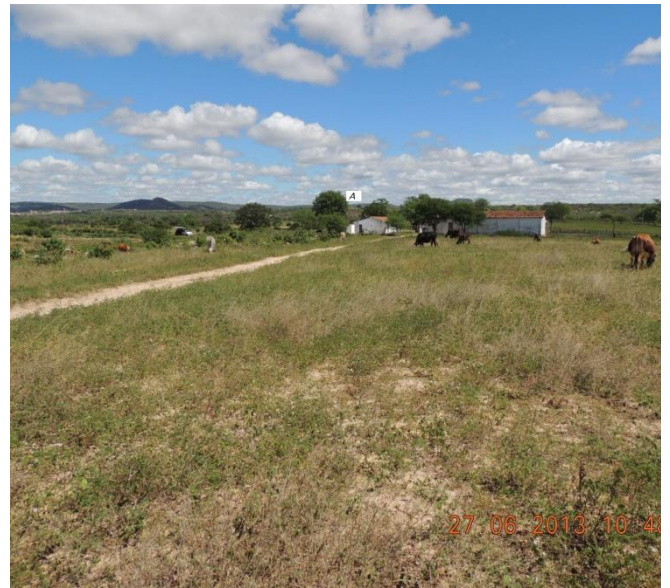
Figura 4 – Área do Canteiro de Obra "Alexandria 05".