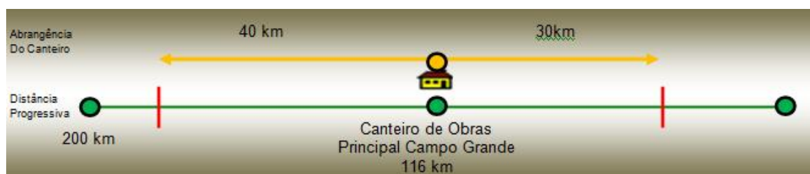
Ilustração 1 - Plano de Ataque e Abrangência para o Canteiro de Campo Grande – RN (Fonte: Plano de construção Abengoa Brasil Construções para o projeto ATE XVII)

Esta área, se escolhida como canteiro de obra, armazenará todo material necessário para a construção do empreendimento no trecho compreendido nos limites apresentados na Ilustração 1.