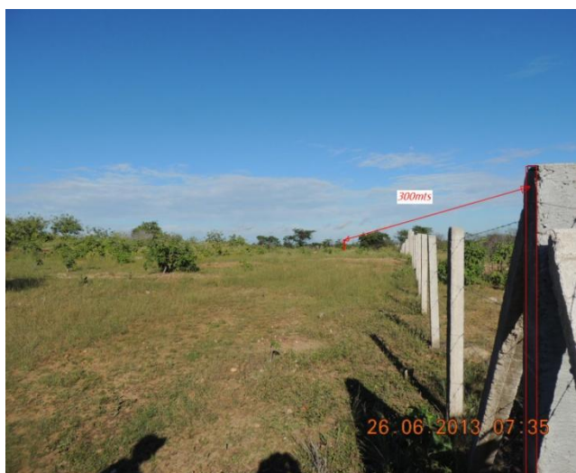
Figura 2 - Área em análise - Campo Grande 03 (Fonte: ATE XVII, 2013).

Esta área possui um terreno plano, de aproximadamente 0,4 ha, com pequenas benfeitorias (Figura 2, Figura 3 e Figura 4), a uma distancia média de 05 (cinco) km do traçado da LT.