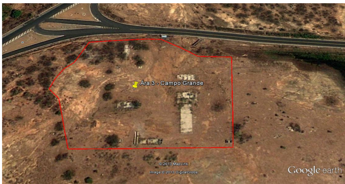
Figura 1 - Localização do canteiro de Obra "Campo Grande 03".

A área do canteiro de obra “Campo Grande 03” está localizada no município de Campo Grande, no estado do Rio Grande do Norte, zona rural, na rodovia federal BR-226, sob as Coordenadas DATUM SIRGAS2000 686572.02E / 9350772.45N (Figura 1), fuso 24, à aproximadamente 1,5 km de distância da cidade de Campo Grande/RN.