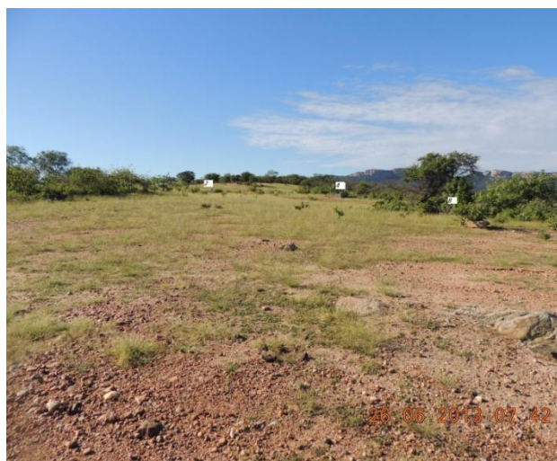
Figura 3 - Área em análise - Campo Grande 03 (Fonte: ATE XVII, 2013).