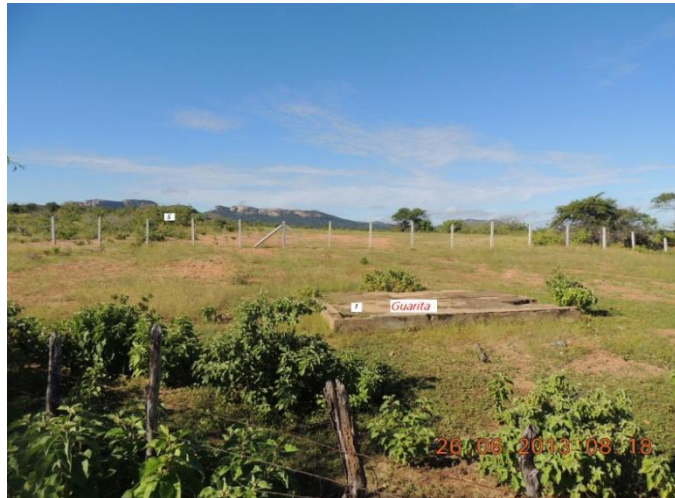
Figura 4 - Área analisada - Campo grande 03 (Fonte: ATE XVII, 2013).

Em seu entorno, encontram-se propriedades rurais, cuja atividade predominante é a agropecuária. Não há presença de vegetação significativa.