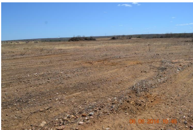
Figura 3 - Área em análise –Paulistana 03

Esta área possui um terreno plano, de aproximadamente 2,49 ha, sem estrutura alguma (Figura 3 e Figura 4).