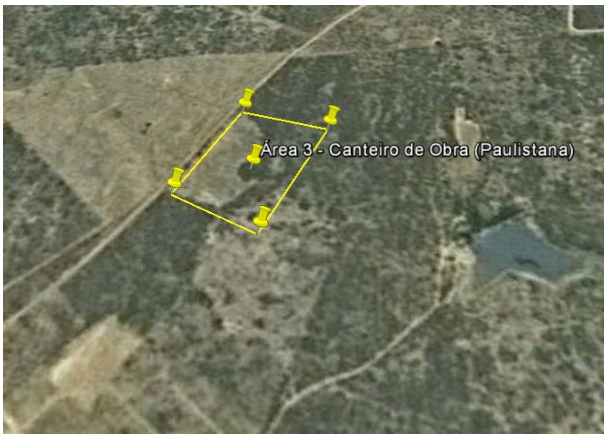
Figura 1 - Localização do canteiro de Obra "Paulistana 03".