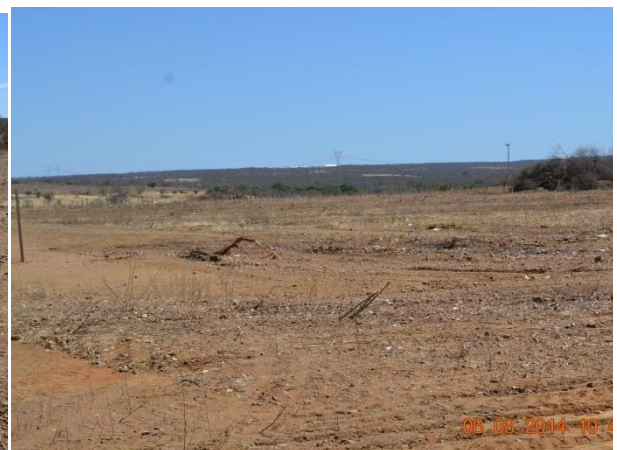
Figura 4 – Área em análise –Paulistana 03