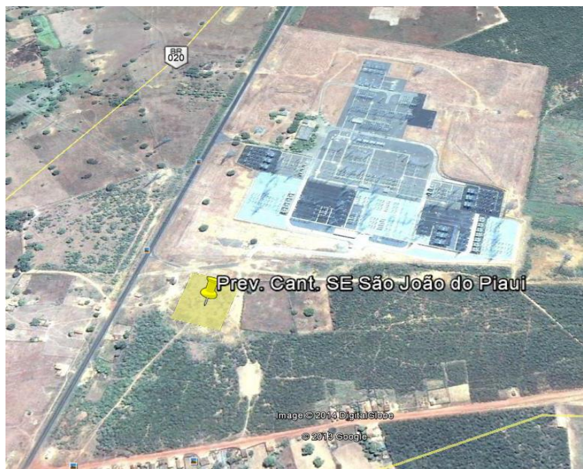
Figura 1 - Localização do canteiro de Obra da SE São João do Piauí.

A área do canteiro de obra utilizado para ampliação da SE São João do Piauí está localizada ao lado da SE, no município de São João do Piauí, no estado do Piauí, zona rural, próximo à rodovia federal BR-020, sob as Coordenadas DATUM SIRGAS2000 804.804968E / 9.074.843N (Figura 1), fuso 23.