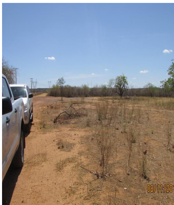
Figura 3 - Área do canteiro de obra para ampliação da SE São João do Piauí