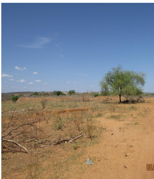
Figura 2 - Área do canteiro de obra para ampliação da SE São João do Piauí

Esta área possui um terreno de aproximadamente 0,6 ha, sem estruturas no local (Figura 2, Figura 3).