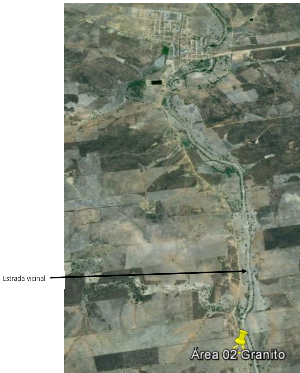
Figura 2 - Acesso ao canteiro de Obra

O principal acesso ao canteiro de obras “Granito 02” é por uma estrada vicinal que dá acesso à região urbana do município (Figura 2).