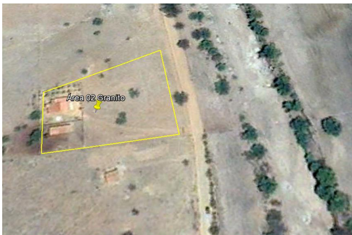
Figura 1 - Localização do canteiro de Obra "Granito 02".

A área do canteiro de obra “Granito 02” está localizada no município de Granito, no estado de Pernambuco, zona rural, sob as coordenadas DATUM SIRGAS2000 432.608E / 9.143.580N (Figura 1), fuso 24.