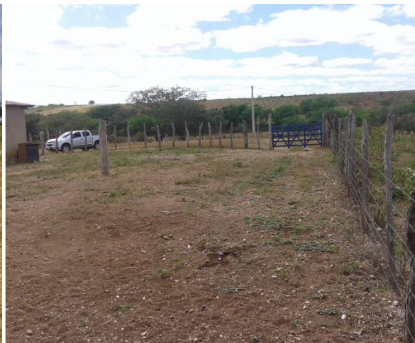
Figura 4 - Área em análise - Granito 02