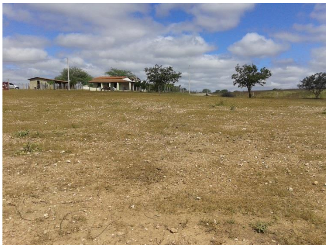
Figura 3 - Área em análise - Granito 02