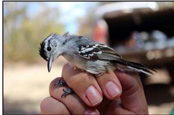
Foto 32- Herpsilochmus sellowi - macho