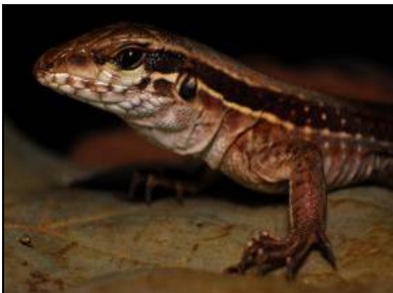
Ameiva ameiva