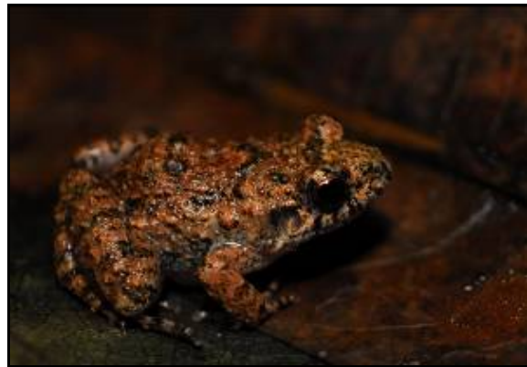
Foto 88 - Leptodactylus martinezi