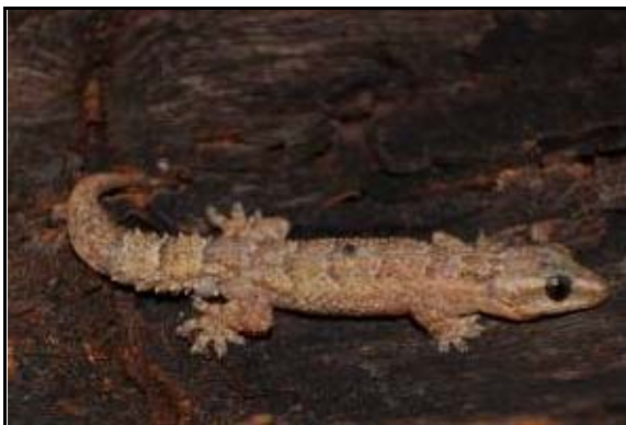
Foto 67 - Hemidactylus brasilianus