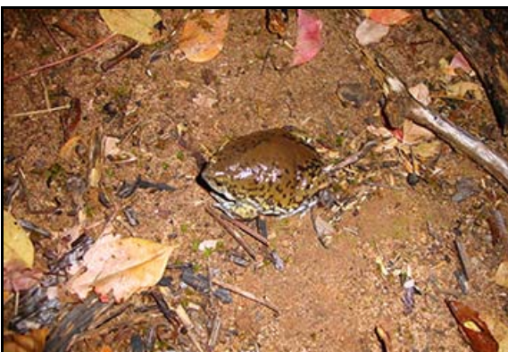
Foto 97 - Dermatoneotus muelleri