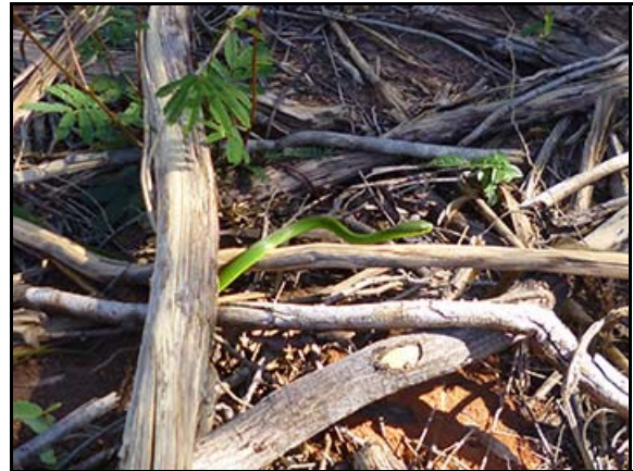
Foto 106 - Philodryas olfersii