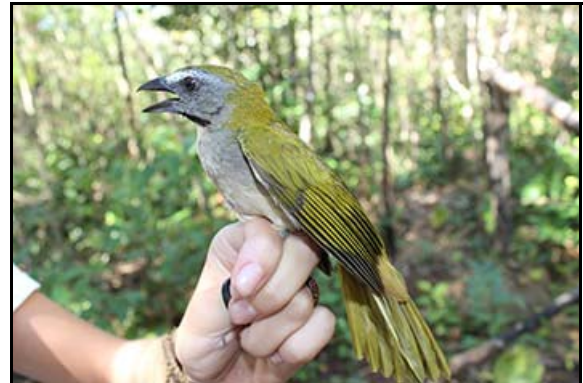
Foto 50- Saltator maximus