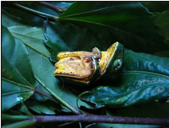
Foto 107 - Phyllomedusa nordestina