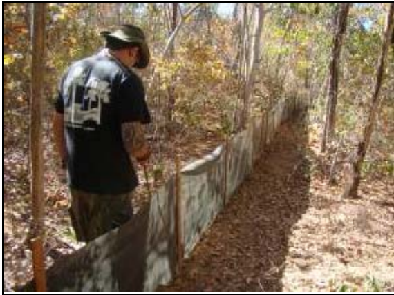
Foto 117 - Integrante da equipe vistoriando armadilha – Pitfall .