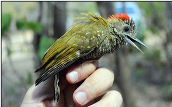
Foto 55 - Veniliornis passerinus - macho