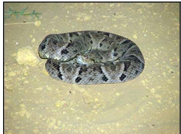
Foto 96 - Bothrops moojeni