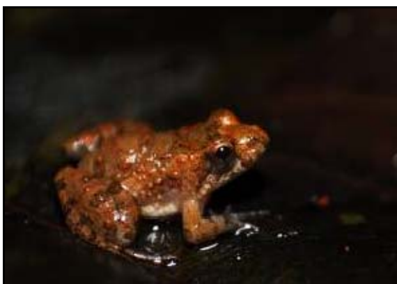
Foto 85 - Pseudopaludicola ternetzi