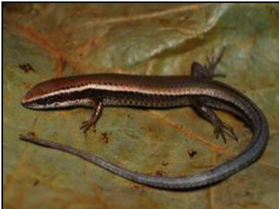
Foto 59 - Micrablepharus maximiliani