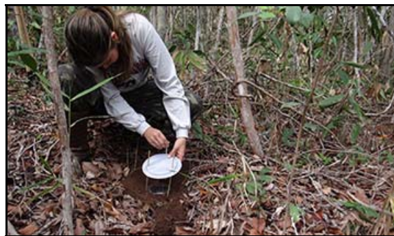
Foto 125 - Armadilha de queda ( pitfall ) para captura de formigas.