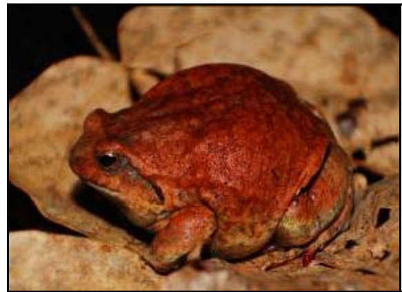
Foto 82 - Eupemphix nattereri