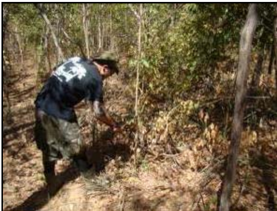
Foto 119 - Integrante da equipe realizando busca ativa diurna na parcela.