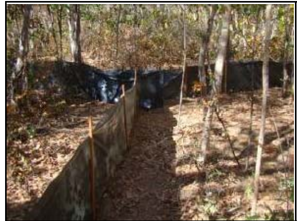
Foto 118 - Vista parcial da armadilha de interceptação e queda – Pitfall .