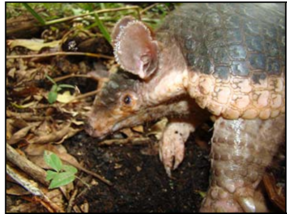
Foto 2 - Cabassous tatouay