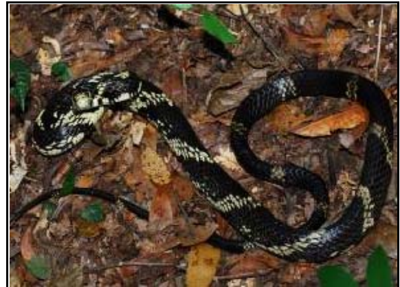
Foto 70 - Spilotes pullatus