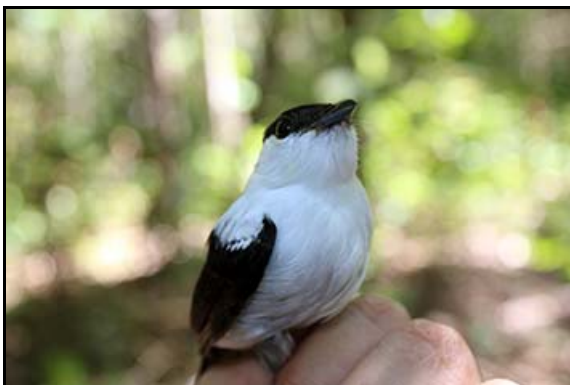
Foto 35 - Manacus manacus - macho