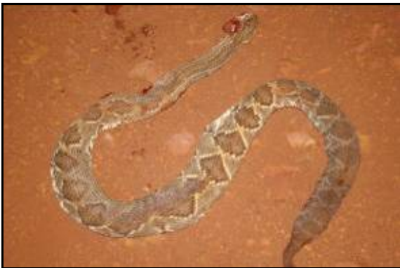
Foto 91 - Crotalus durissus atropelada.