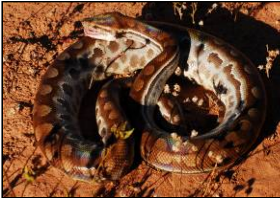
Foto 75 - Epicrates cf. assisi