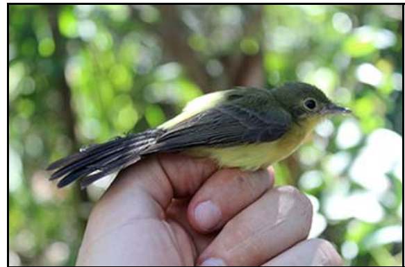
Foto 40 - Myiobius atricaudus