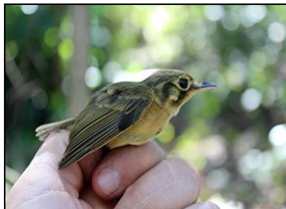
Foto 48- Platyrhynchus mystaceus