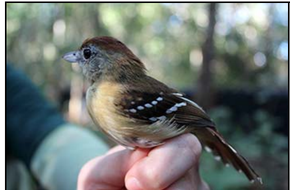
Foto 52 - Thamnophilus pelzelni - fêmea