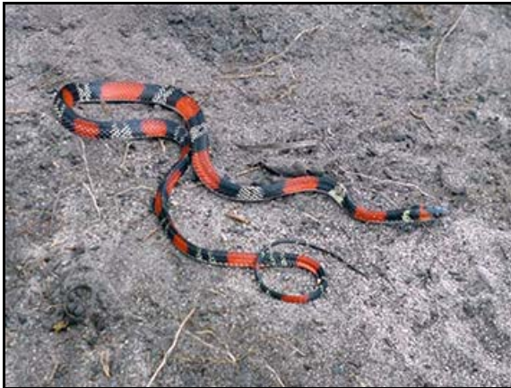
Foto 105 - Oxyrhopus trigeminus