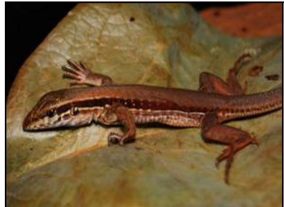
Foto 62 - Ameiva ameiva