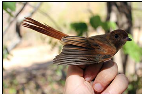
Foto 22 - Casiornis rufus