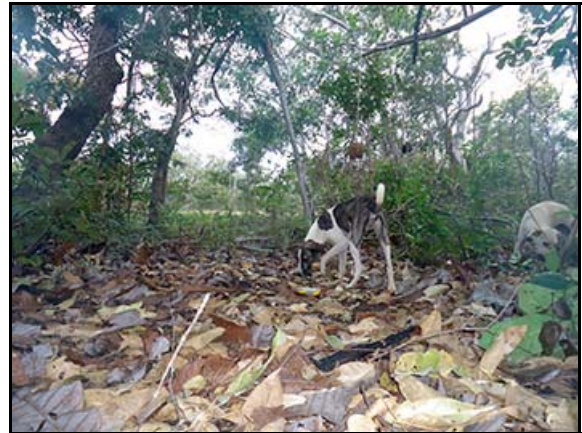
Foto 14 - Canis familiaris