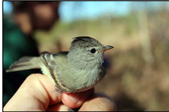
Foto 20 - Camptostoma obsoletum