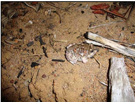
Foto 109 - Pleurodema diplilister