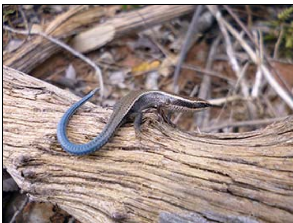
Foto 103 - Micrablepharus maximiliani