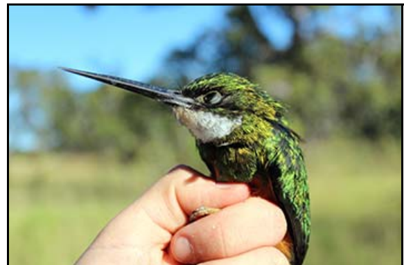
Foto 30 - Galbula ruficauda - macho