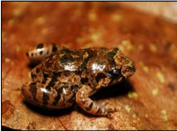
Foto 81 - Laeptodactylus martinezi