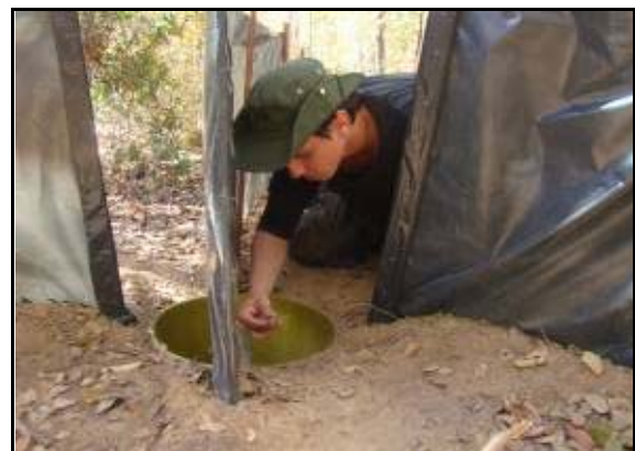
Foto 116 - Integrante da equipe vistoriando Pitfall e capturando lagarto.