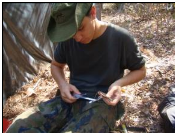
Foto 121 - Integrante da equipe medindo lagarto Ameivula ocellifera .