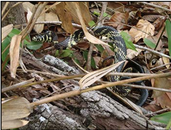
Foto 111 - Spilotes pullatus