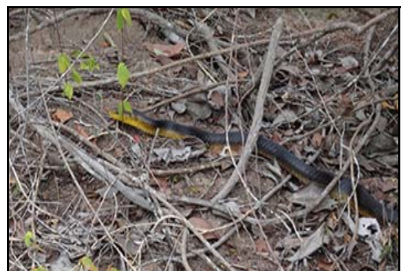
Foto 98 - Drymarchon corais