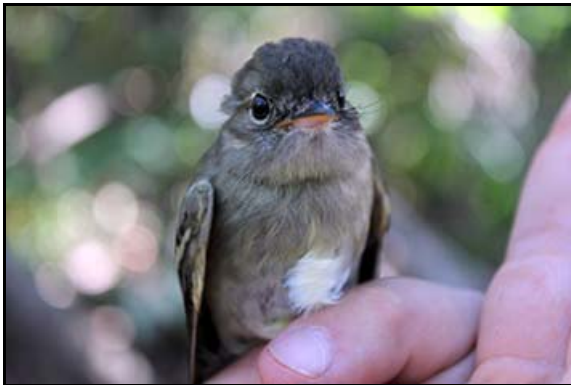
Foto 45 - Phaeomyias murina