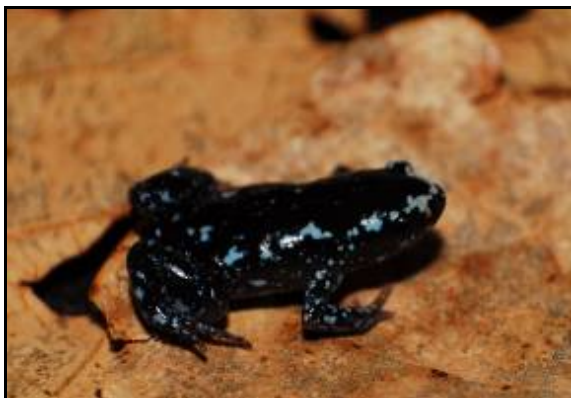
Foto 79 - Chiasmocleis albopunctata