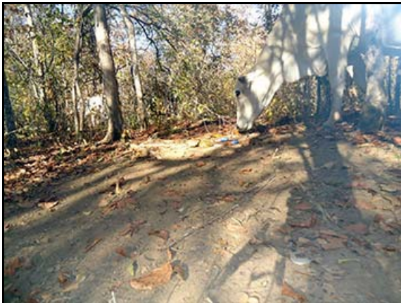
Foto 15 - Bos linnaeus