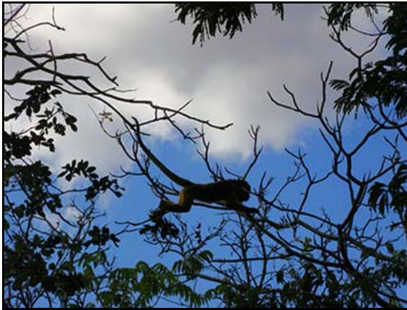
Foto 1 - Alouatta caraya