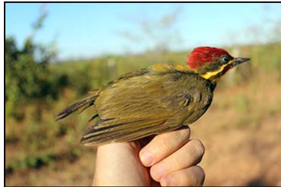
Foto 46 - Piculus crysochloros - macho