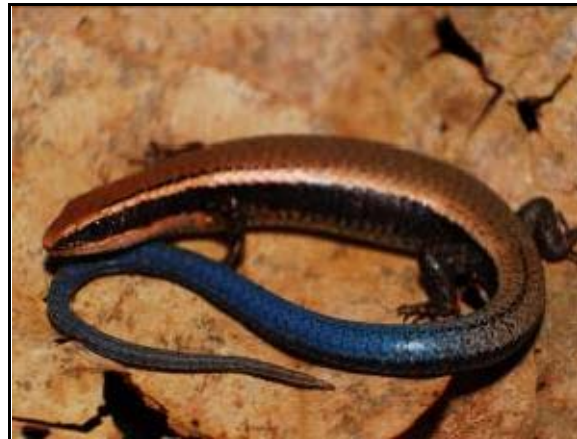
Foto 66 - Micrablepharus maximiliani