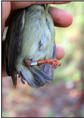
Foto 27-- Exemplo de anilhamento