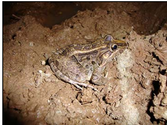
Foto 102 - Leptodactylus latrans