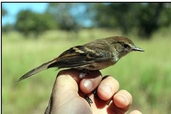
Foto 23 - Cnemotriccus fuscatus