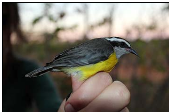
Foto 24 - Coereba flaveola