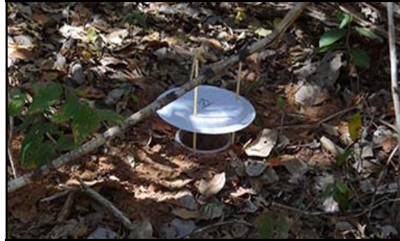
Foto 123 - Armadilha de queda ( pitfall ) para captura de formigas.