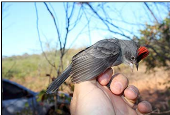
Foto 33 - Lanio pileatus