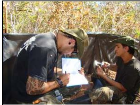
Foto 112 - Integrantes da equipe executando procedimento de medição em lagarto.