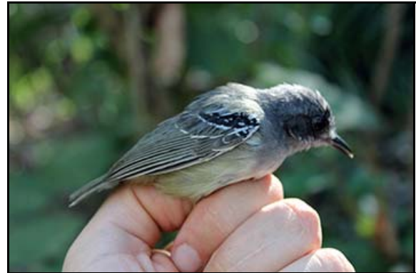
Foto 26 - Dysithamnus mentalis