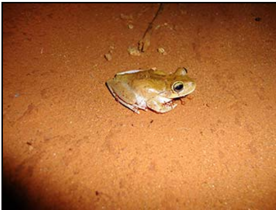
Foto 101 - Hysiboas crepitans