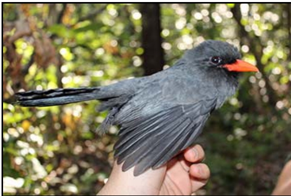
Foto 39- Monasa nigrifrons