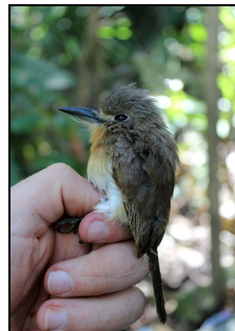
Foto 42- Nonnula rubecula