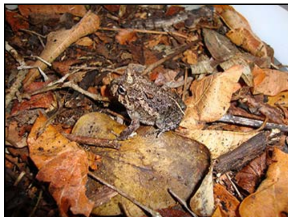
Foto 104 - Odontophrynus carvalhoi