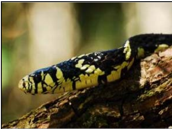
Foto 71 - Spilotes pullatus