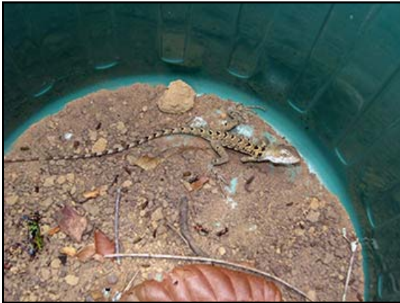
Foto 99 - Enyalius bibroni