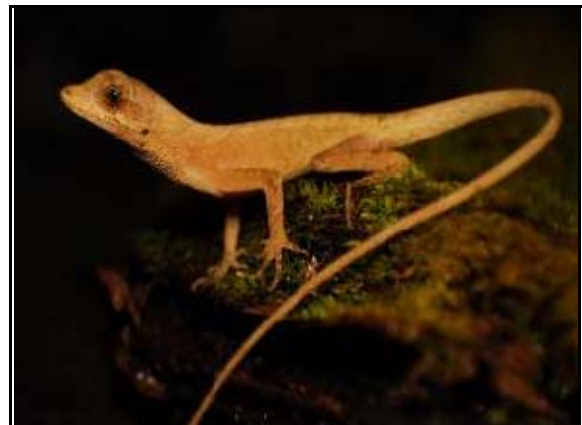
Foto 72 - Norops chrysoleps