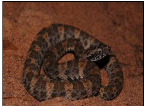
Foto 60 - Bothrops lutzi