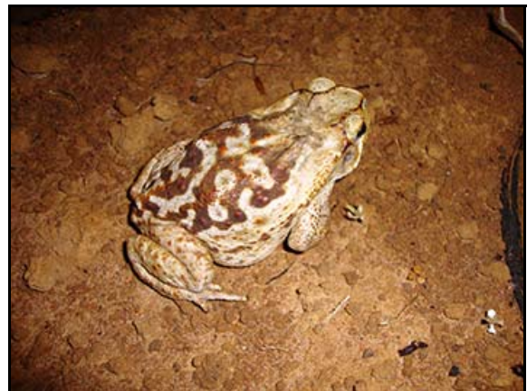
Foto 110 - Rhinella jimi