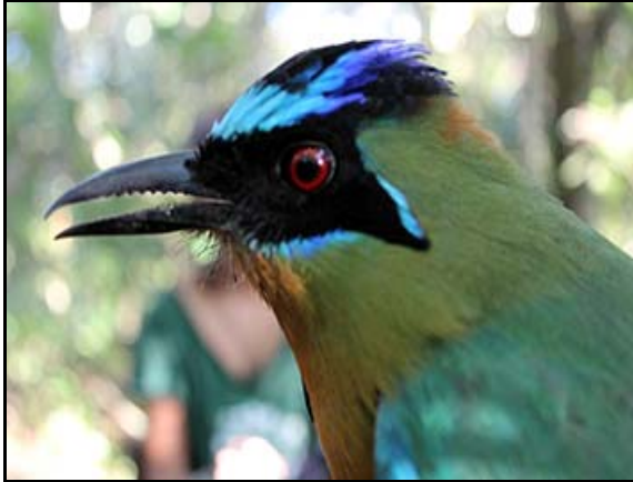
Foto 37 - Momotus momota