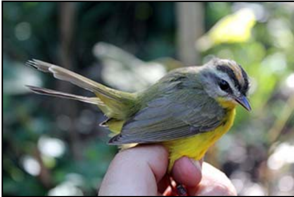
Foto 19 - Basileuterus culicivorus