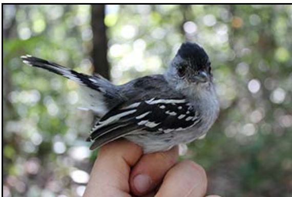
Foto 53 - Thamnophilus pelzelni - macho