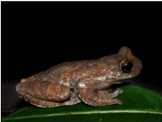
Foto 83 - Dendropsophus soaresi