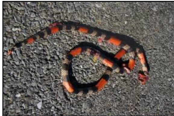
Foto 92 - Micrurus ibiboboca atropelada.