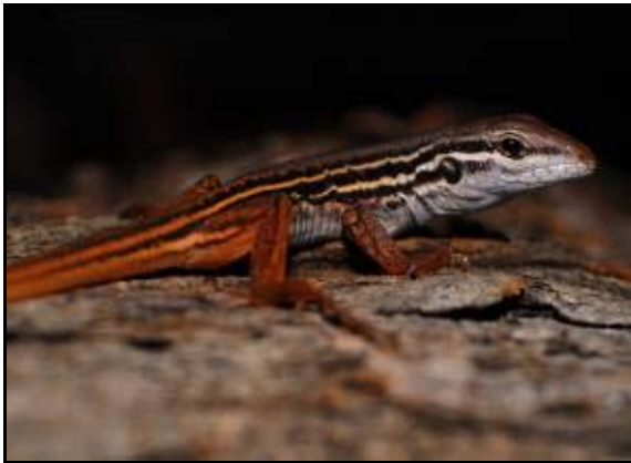
Foto 69 - Ameivula ocellifera