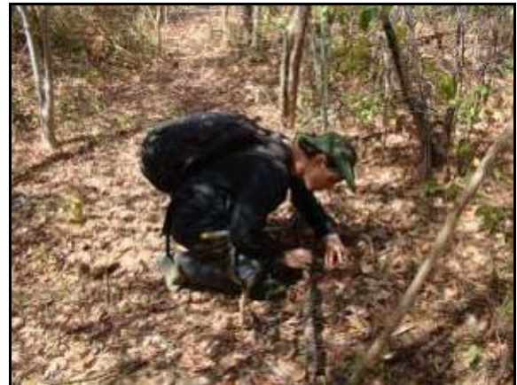
Foto 120 - Integrante da equipe realizando busca ativa diurna na parcela.