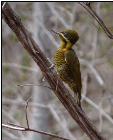
Foto 47 - Piculus crysochloros - fêmea