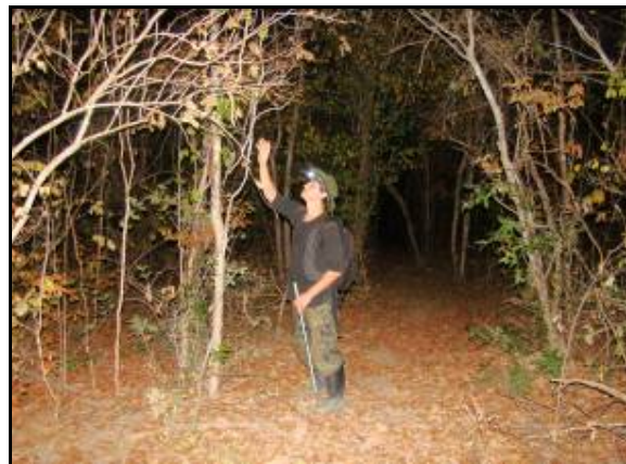
Foto 114 - Integrante da equipe realizando busca ativa noturna na parcela.