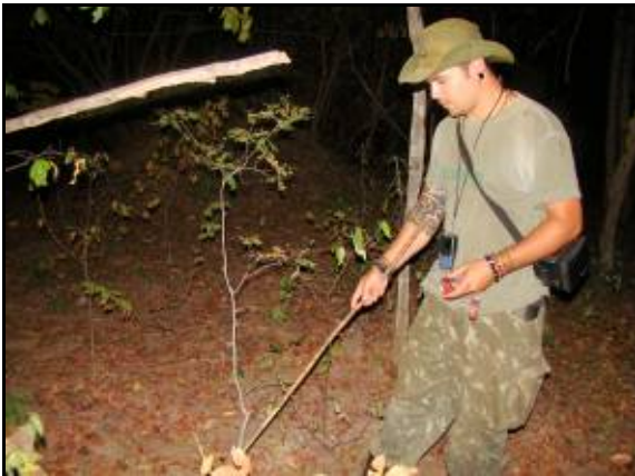
Foto 113 - Integrante da equipe realizando busca ativa noturna na parcela.