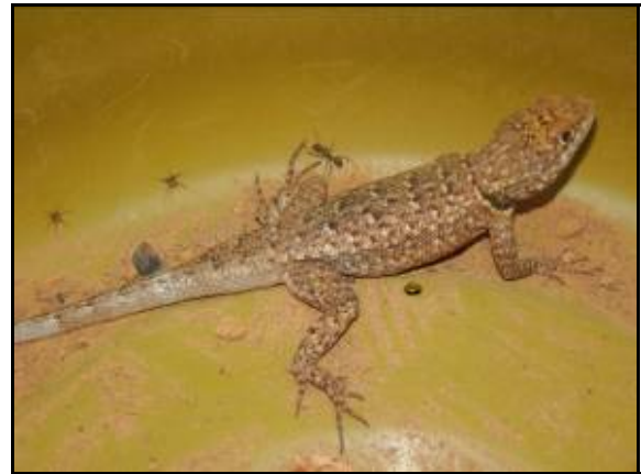
Foto 94 - Tropidurus oreadicus , capturado na armadilha de interceptação e queda - Pitfall .