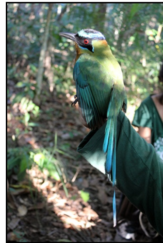
Foto 38 - Momotus momota