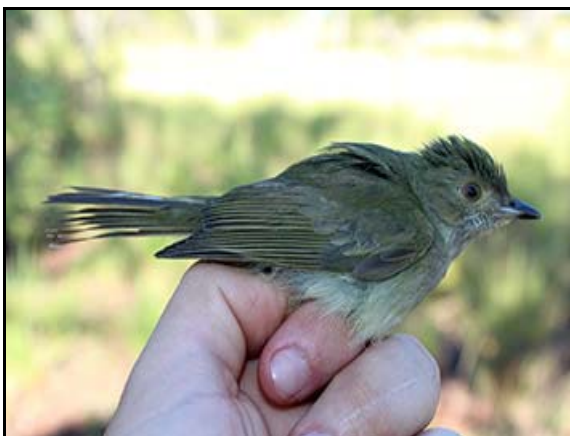
Foto 41 - Neopelma pallescens