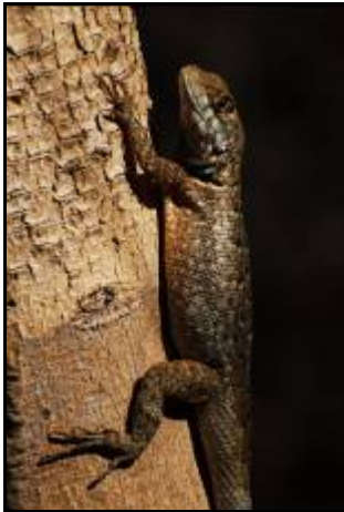
Foto 63 - Tropidurus oreadicus