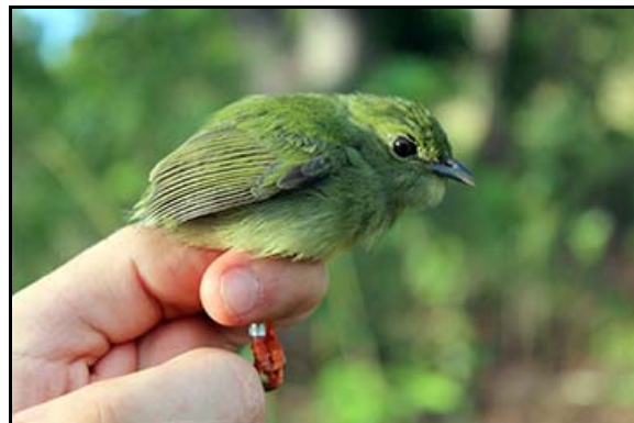
Foto 34 - Manacus manacus - fêmea