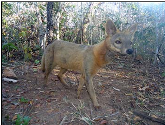
Foto 17 - Lycalopex vetulus