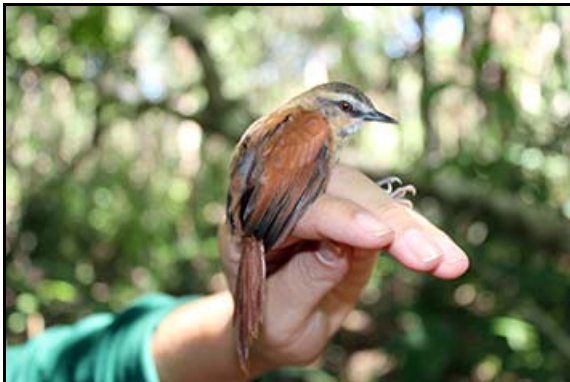
Foto 51- Synallaxis scutata