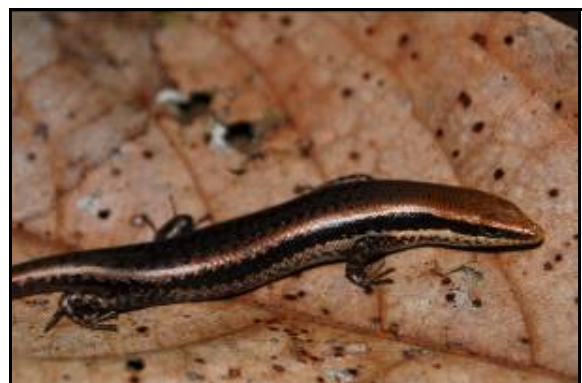
Foto 74 - Notomabuya frenata