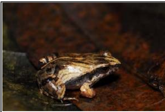
Foto 89 - Physalaemus albifrons