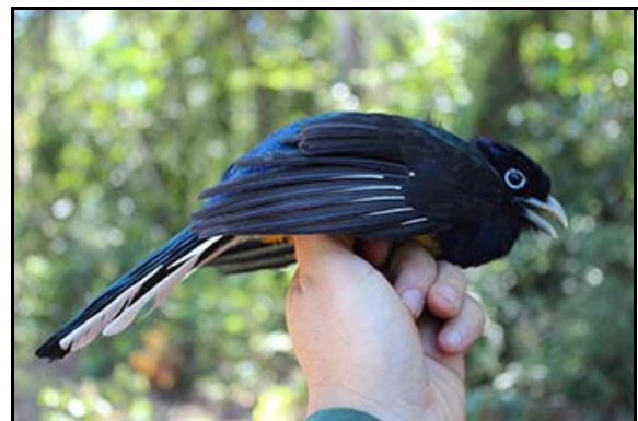
Foto 54- Trogon viridis - macho