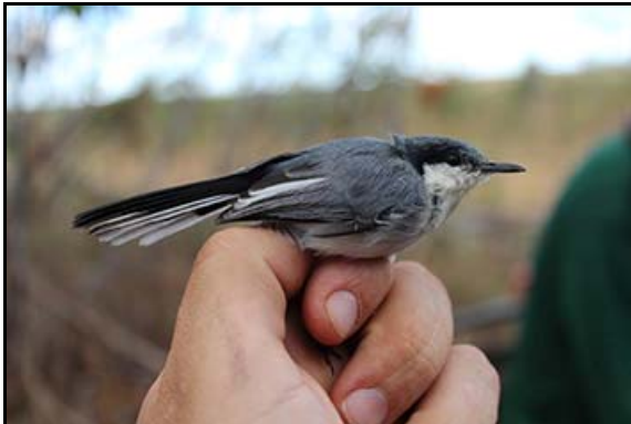
Foto 49- Polioptila plumbea