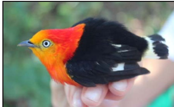
Foto 56 - Pipra fasciicauda - macho