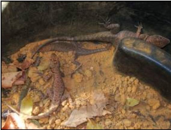
Foto 93 - Tropidurus oreadicus , capturados na armadilha de interceptação e queda - Pitfall .