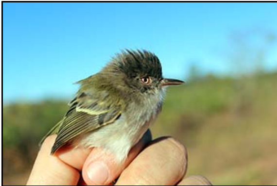
Foto 31 - Hemitriccus margaritaceiventer