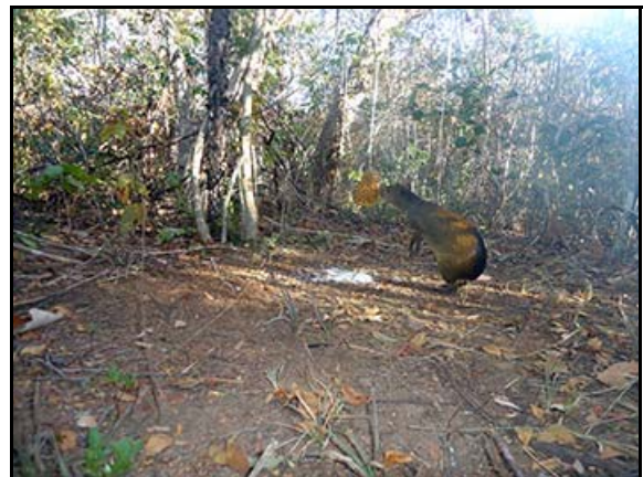
Foto 18 - Dasyprocta leporina