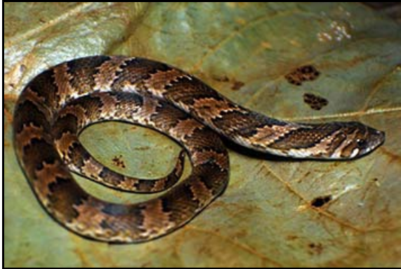
Foto 57- Xenodon aff. histicus