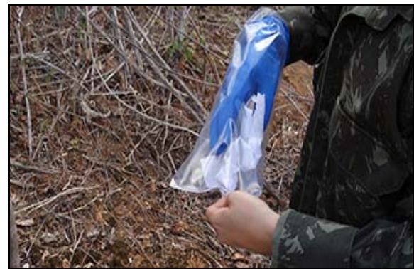
Foto 131 – Armazenamento das iscas para posterior triagem e identificação.