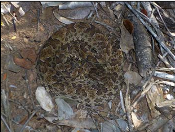
Foto 95 - Bothropoides neuwiedii