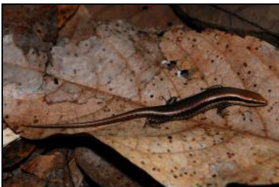
Foto 73 - Notomabuya frenata