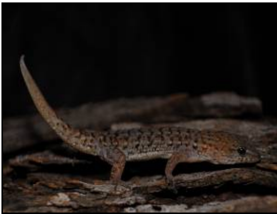
Foto 77 - Gymnodactylus geckoides