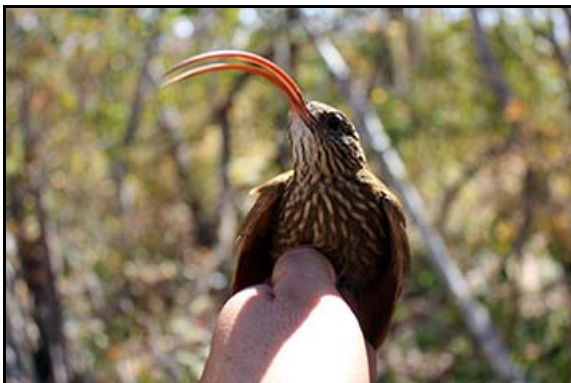
Foto 21 - Campylorhamphus trochilirostris