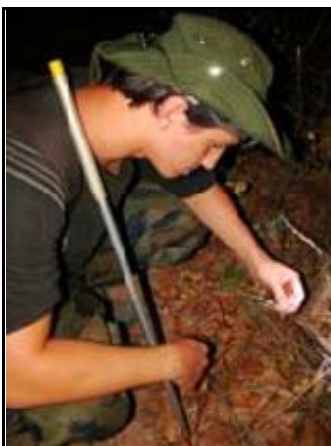
Foto 115 - Integrante da equipe capturando lagarto em busca ativa noturna na parcela.