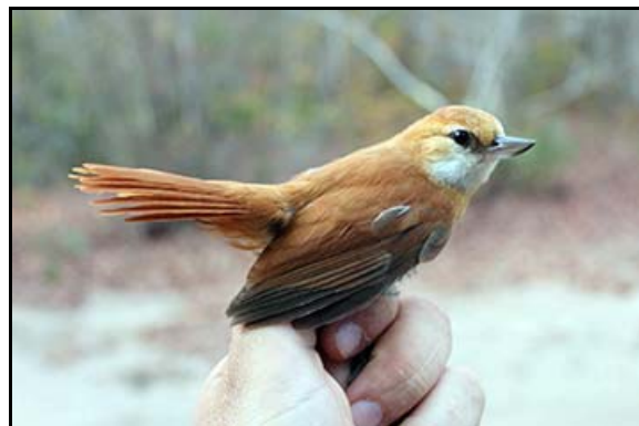
Foto 36- Megaxenops parnaguae