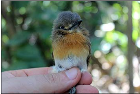
Foto 43 - Nonnula rubecula