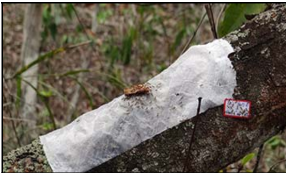
Foto 124 - Iscas Atrativas para captura de formigas.