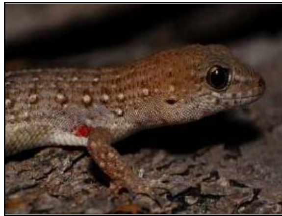
Foto 78 - Gymnodactylus geckoides