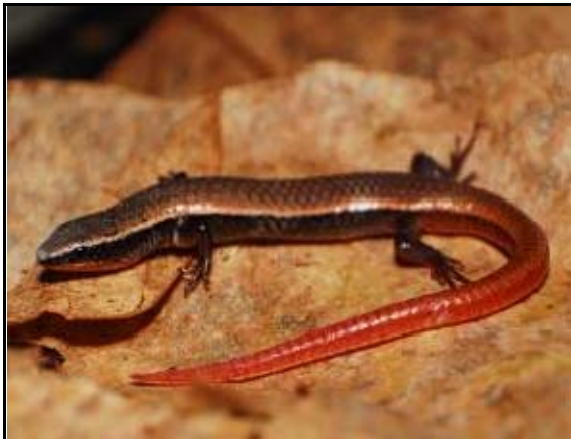
Foto 65 - Procellosaurinus erythrocerus