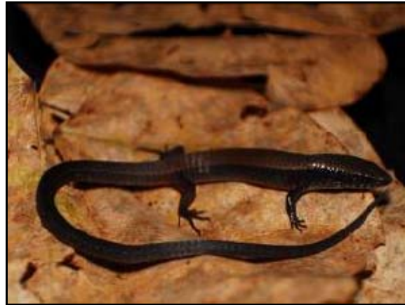
Foto 64 - Colobosaura modesta