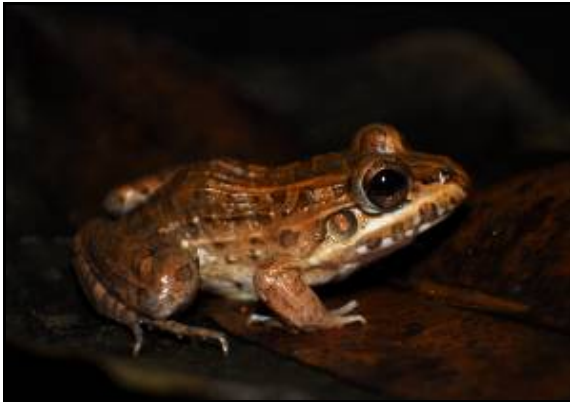
Foto 87 - Leptodactylus chaquensis