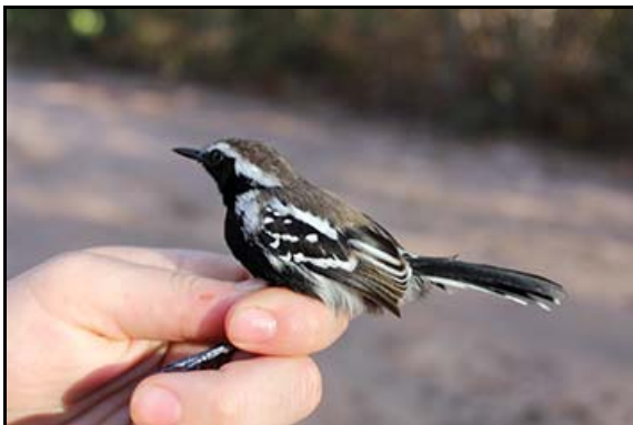
Foto 29-- Formicivora melanogaster - macho