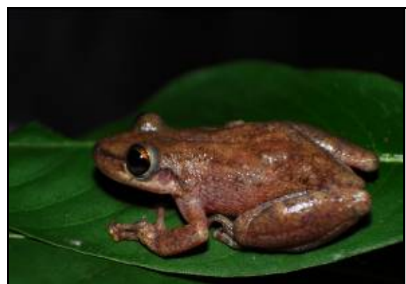
Foto 86 - Scinax x-signatus