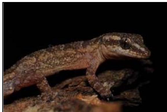
Foto 68 - Hemidactylus brasilianus