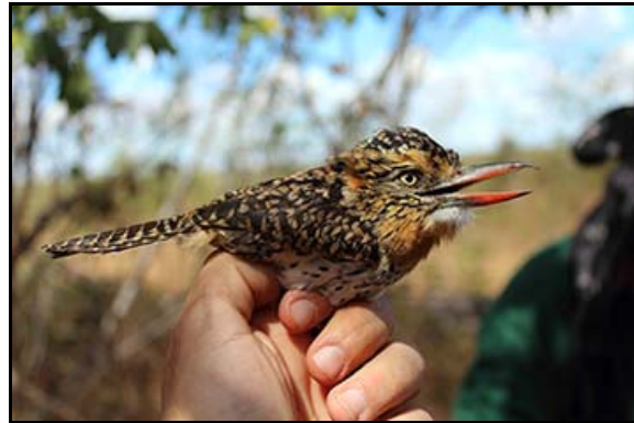
Foto 44 - Nystalus maculatus