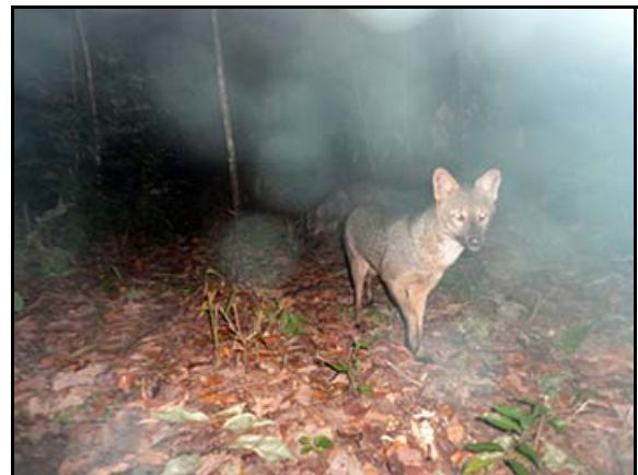
Foto 4 - Cerdocyon thous