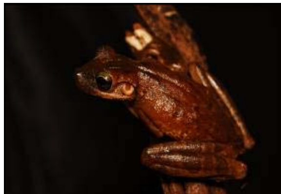
Foto 80 - Osteocephalus taurinus