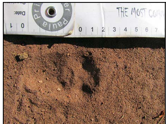
Foto 6 - Pegada de Eira barbara