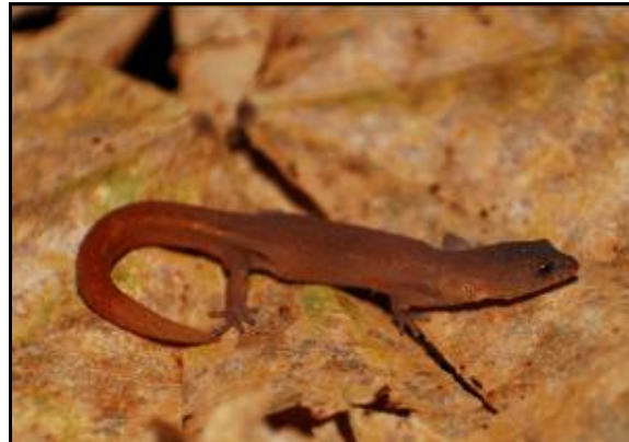
Foto 76 - Coleodactylus meridionalis