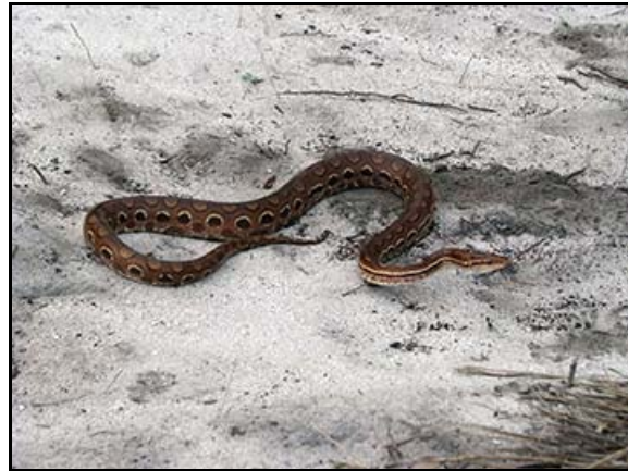
Foto 100 - Epicrates assisi