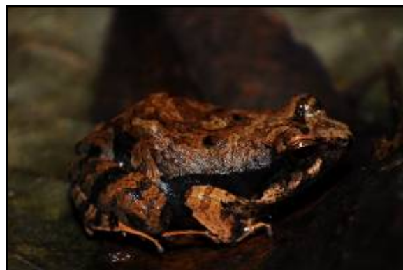
Foto 90 - Physalaemus centralis