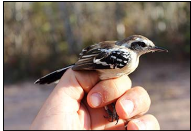
Foto 28- Formicivora melanogaster - femea