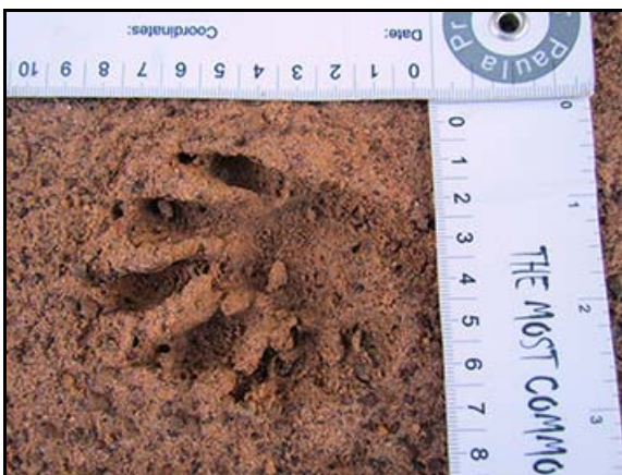
Foto 5 - Pegada de Procyon cancrivorus