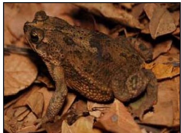
Foto 84 - Rhinella granulosa