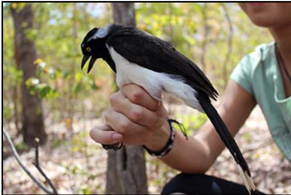
Foto 25- Cyanocorax cyanopogon