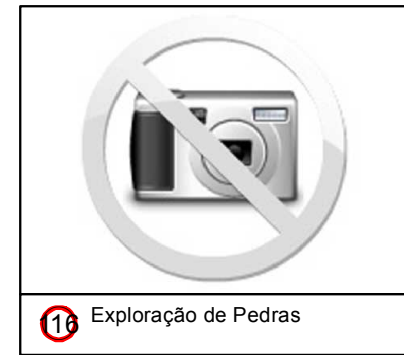
16 Exploração de Pedras

© Ecology & Environment do Brasil GIS Department W:\2619-LT-Miracema-Sapeacu\EIA\Rev_00\IMXD\2619-00-EIA-MP-5001-00_PontosNotaveisF24.mxd - 18/10/2013