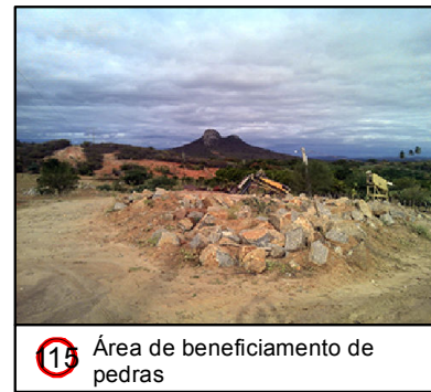
15 Área de beneficiamento de pedras