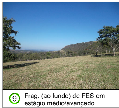
9 Frag. (ao fundo) de FES em estágio médio/avançado