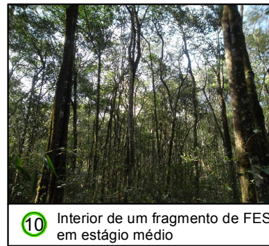
10 Interior de um fragmento de FES em estágio médio