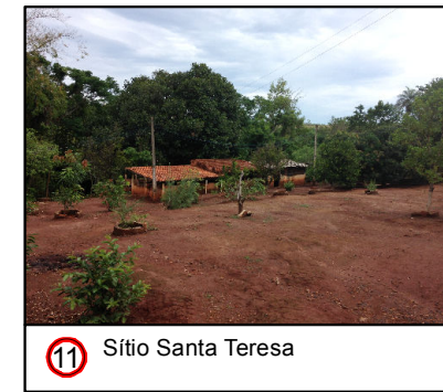
11 Sítio Santa Teresa