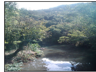
38 Paisagem com rio Camanducaia ao fundo