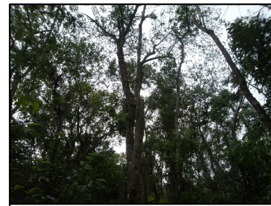
37 Interior de um frag. de FES em estágio médio/avançado