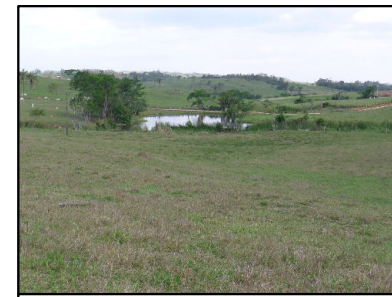
25 Paisagem com pastagem e açude ao fundo

© Ecology & Environment do Brasil GIS Department L:\2818_LT500KV_Estretto-FernaoDias\EIA\MD\2818-00-EIA-MP-5002_PontosNotaveis.mxd - 31/01/2015