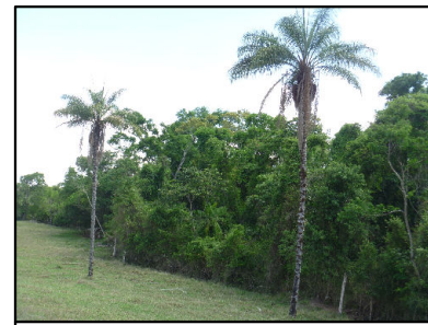
24 Fragmento de FES em estágio inicial/médio