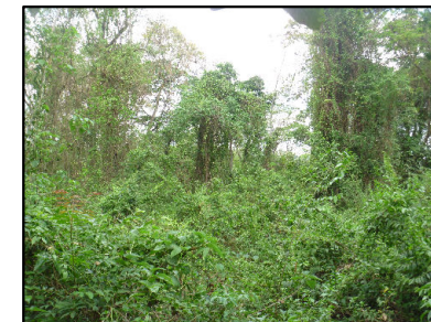
19 Interior de um fragmento de FES em estágio inicial

© Ecology & Environment do Brasil GIS Department L:\2818_LT500KV_Estreito-FernaoDias\EIA\MD\2818-00-EIA-MP-5002_PontosNotaveis.mxd - 31/01/2015