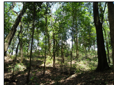
18 Vista do interior do frag. de FES em estágio inicial/médio