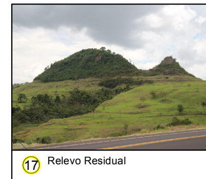
17 Relevo Residual