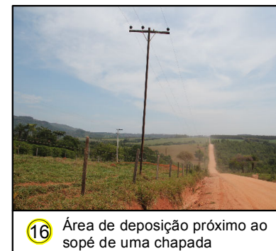
16 Área de deposição próximo ao sopé de uma chapada