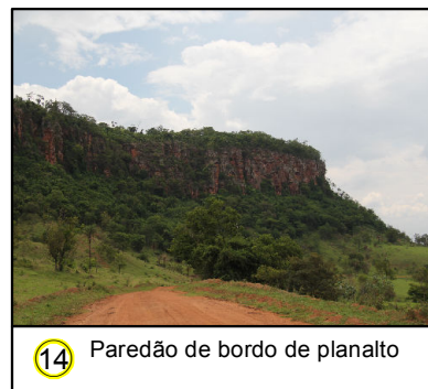
14 Paredão de bordo de planalto