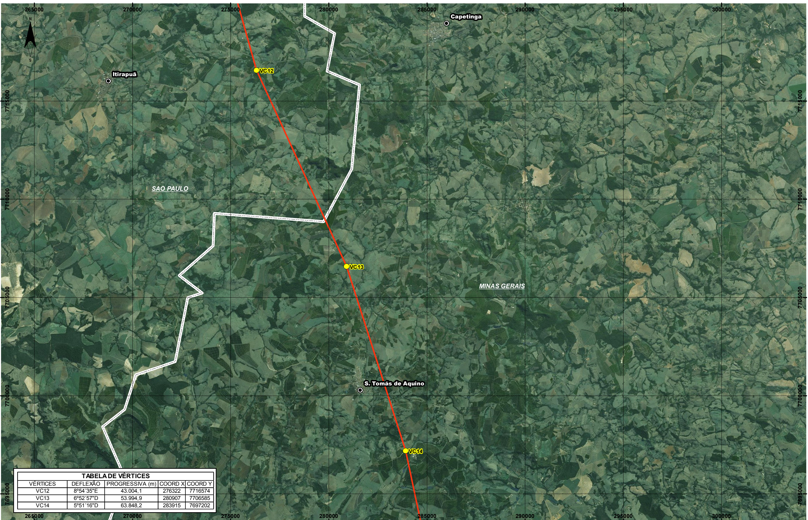
TABELA DE VÉRTICES