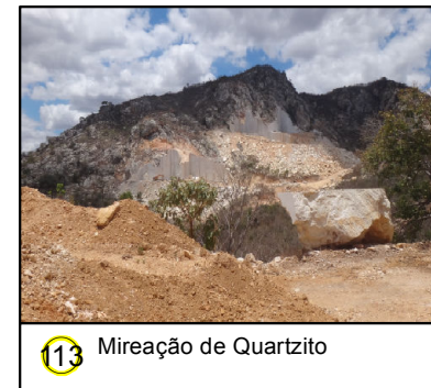
13 Mireação de Quartzito

© Ecology & Environment do Brasil GIS Department L:\3182_LT500KV/Bacabeira_Pecem\EIA\MXD\3182-00-EIA-MP-5002-00_PontosNotaveis_245_E.mxd - 22/10/2016