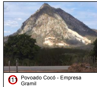
11 Povoado Cocó - Empresa Gramil