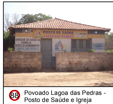
88 Povoado Lagoa das Pedras - Posto de Saúde e Igreja

© Ecology & Environment do Brasil GIS Department L:\3182_LT500KV/Bacabeira_Pecem\EIA\IMXD\3182-00-EIA-MP-5002-00_PontosNotaveis_24S_D.mxd - 22/10/2016