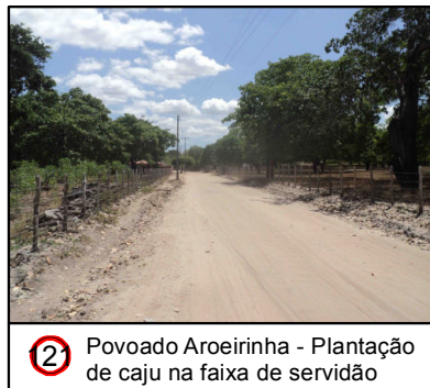
2 Povoado Aroeirinha - Plantação de caju na faixa de servidão