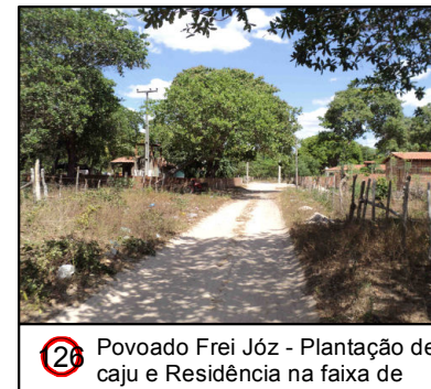
26 Povoado Frei Józ - Plantação de caju e Residência na faixa de

© Ecology & Environment do Brasil GIS Department L:\3182_LT500KV/Bacabeira_Pecem\EIA\MP\5002-00-EIA-MP-5002-00_PontosNotaveis_24S_D.mxd - 22/10/2016