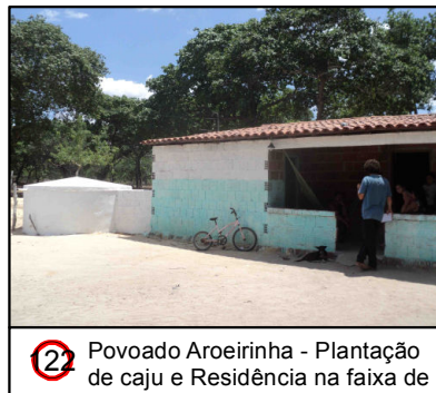
2 Povoado Aroeirinha - Plantação de caju e Residência na faixa de