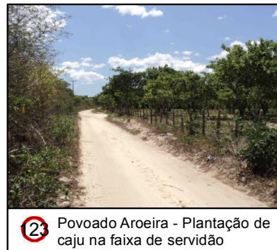
2 Povoado Aroeira - Plantação de caju na faixa de servidão