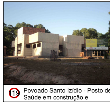
19 Povoado Santo Izídio - Posto de Saúde em construção e

© Ecology & Environment do Brasil GIS Department L:\3182_LT500KV/Bacabeira_Pecem\EIA\MP-5002-00-EIA-MP-5002-00_PontosNotaveis_24S_D.mxd - 22/10/2016