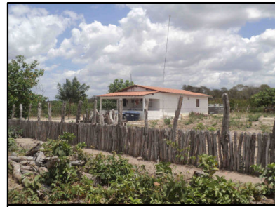
10 Assentamento Santa Terezinha - Povoado Boa Esperança