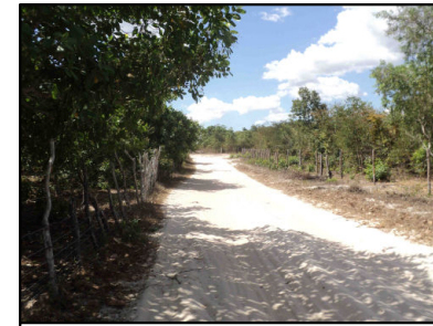
12 Distrito Parazinho

© Ecology & Environment do Brasil GIS Department L:\3182_LT500KV/Bacabeira_Pecem\EIA\IMXD\3182-00-EIA-MP-5002-00_PontosNotaveis_24S_D.mxd - 22/10/2016