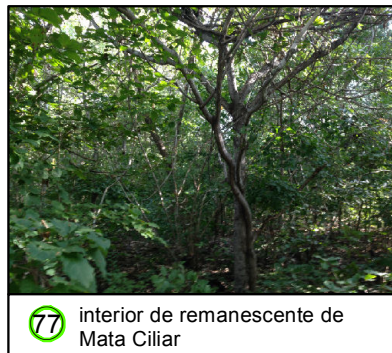
77 interior de remanescente de Mata Ciliar