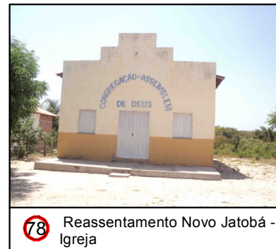
78 Reassentamento Novo Jatobá - Igreja