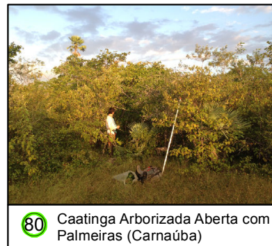
80 Caatinga Arborizada Aberta com Palmeiras (Carnaúba)

© Ecology & Environment do Brasil GIS Department L:\3182_LT500KV Bacabeira_Pecem\EIA\MP\5003-00_PontosNotaveis_24S_C.mxd - 22/10/2016