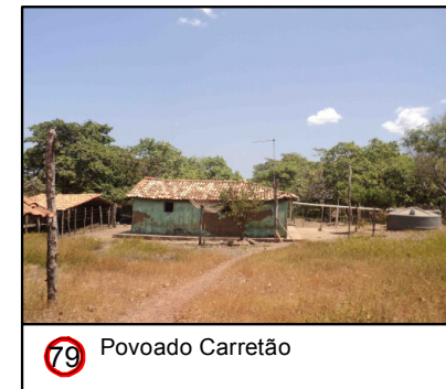
79 Povoado Carretão