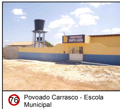
76 Povoado Carrasco - Escola Municipal