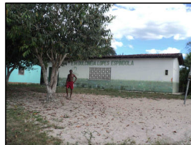
20 Pov. Vila Nova no Ass. Pacas do Marçal - Escola Mun.

© Ecology & Environment do Brasil GIS Department L:\3182_LT500KV Bacabeira_Pecem\EIA\IMXD\3182-00-EIA-MP-5003-00_PontosNotaveis_23S_A.mxd - 22/10/2016