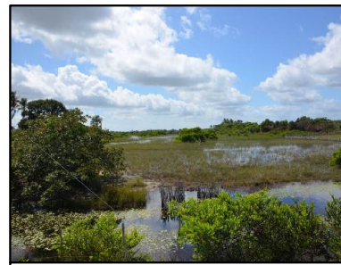
50 Restinga presente na Região de Amostragem 1

© Ecology & Environment do Brasil GIS Department L:\3182_LT500KV Bacabeira_Pecem\EIA\IMXD\3182-00-EIA-MP-5003-00_PontosNotaveis_23S_A.mxd - 22/10/2016