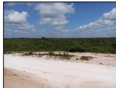
44 Planície arenosa recoberta por remanescentes de Restinga

© Ecology & Environment do Brasil GIS Department L:\3182_LT500kVBacabeira_Pecem\EIA\IMXD\3182-00-EIA-MP-5003-00_PontosNotaveis_23S_A.mxd - 22/10/2016