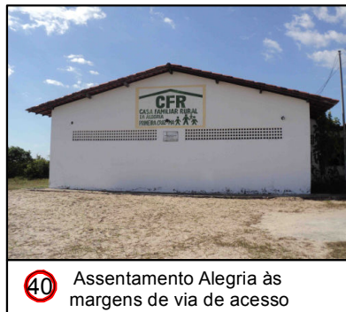
40 Assentamento Alegria às margens de via de acesso