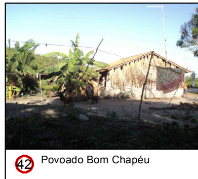
42 Povoado Bom Chapéu