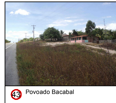
43 Povoado Bacabal

© Ecology & Environment do Brasil GIS Department L:\3182_LT500kVBacabeira_Pecem\EIA\IMXD\3182-00-EIA-MP-5003-00_PontosNotaveis_23S_A.mxd - 22/10/2016