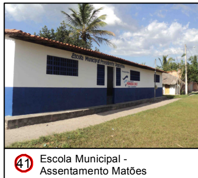
41 Escola Municipal - Assentamento Matões