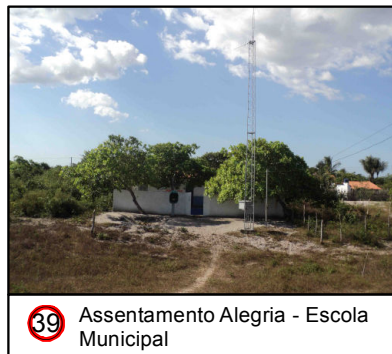
39 Assentamento Alegria - Escola Municipal

© Ecology & Environment do Brasil GIS Department L:\3182_LT500KV Bacabeira_Pecem\EIA\IMXD\3182-00-EIA-MP-5003-00_PontosNotaveis_23S_A.mxd - 22/10/2016