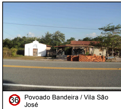
36 Povoado Bandeira / Vila São José