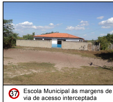
37 Escola Municipal às margens de via de acesso interceptada