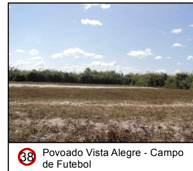
38 Povoado Vista Alegre - Campo de Futebol