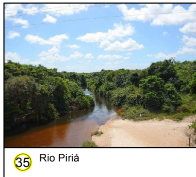
35 Rio Piraí