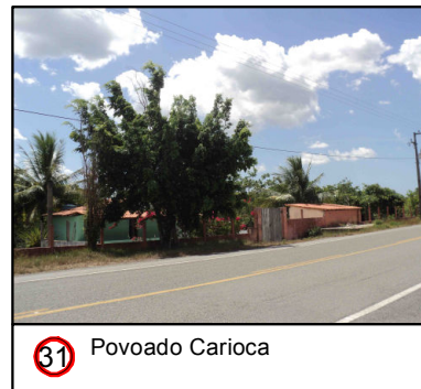
31 Povoado Carioca

© Ecology & Environment do Brasil GIS Department L:\3182_LT500KV Bacabeira_Pecem\EIA\IMXD\3182-00-EIA-MP-5003-00_PontosNotaveis_23S_A.mxd - 22/10/2016