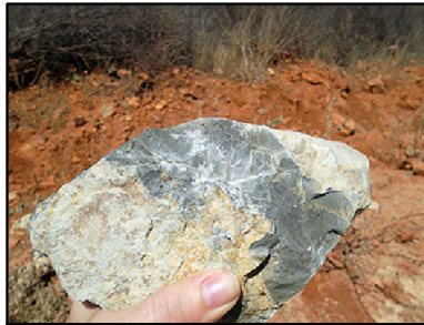
③ Calcarenito preto das Litofáceis Jussara