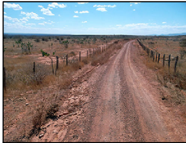
Processo de erosão laminar