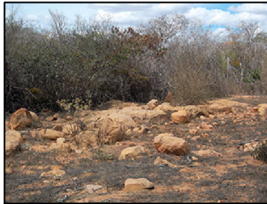
7 Arenitos feldspáticos das Litofácies Morro do Chapéu