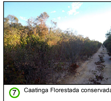
7 Caatinga Florestada conservada