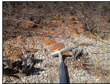
33 Coberturas detrito-lateríticas ferruginosas