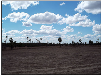
32 Planossolo Nátrico alocado em Terraço Fluvial