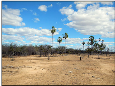
31 Caatinga Parque com carnaúba